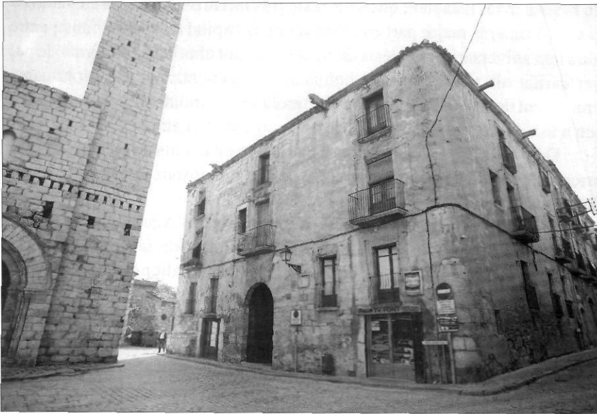
La casa del Castlà.

En total es tracta de censals per valor de 742 lliures de capital (que al 5% donen un interès anual de 37,1 lliures), sense comptar les pensions endarrerides. Podia existir algun altre deute que desconexim. Aquests deutes els apuntem com a indicadors de la davallada dels Vilafranca, que també perderen la descendència en línia masculina.