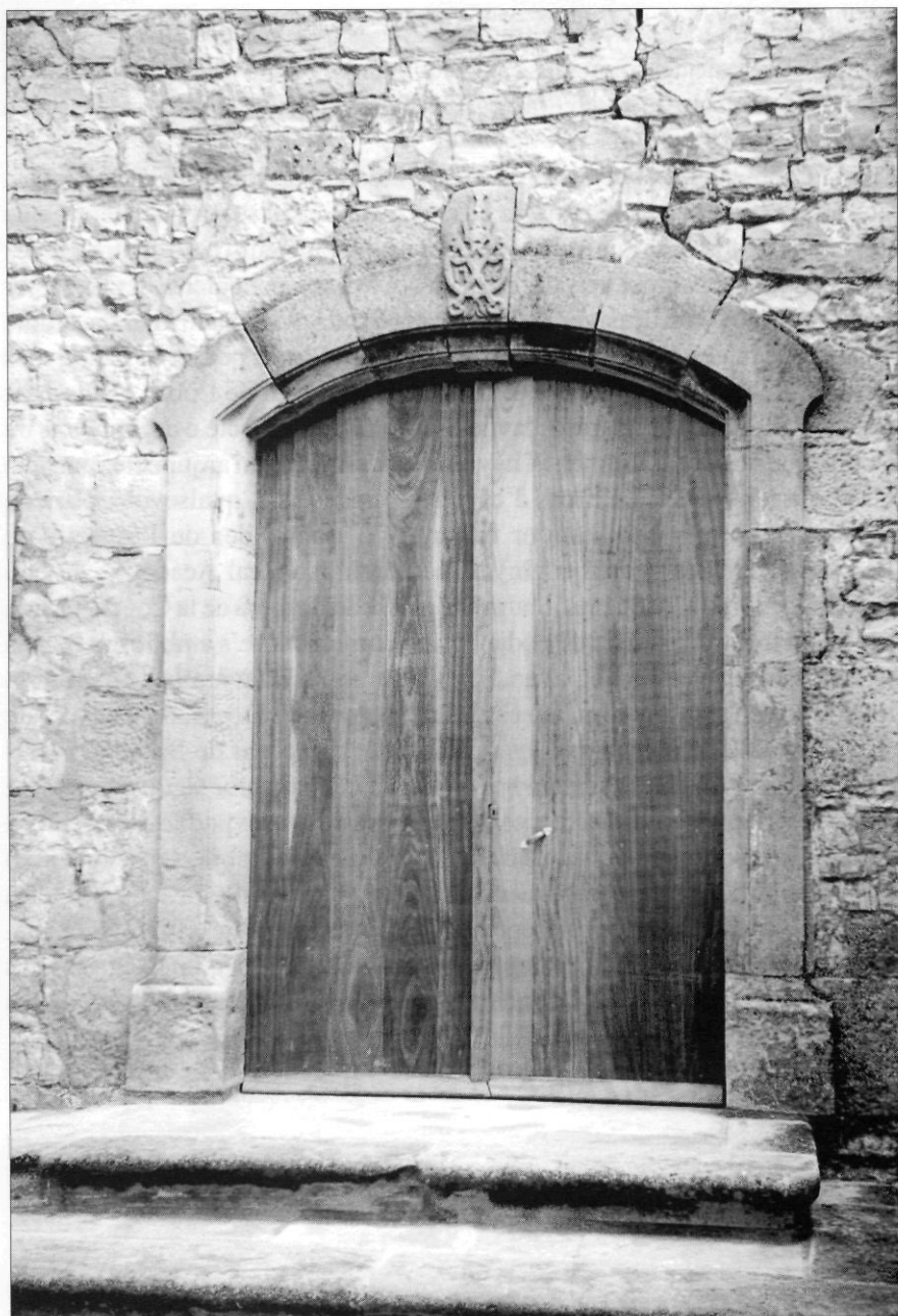
Portalada de l'església amb les armes del titular, sant Pere.