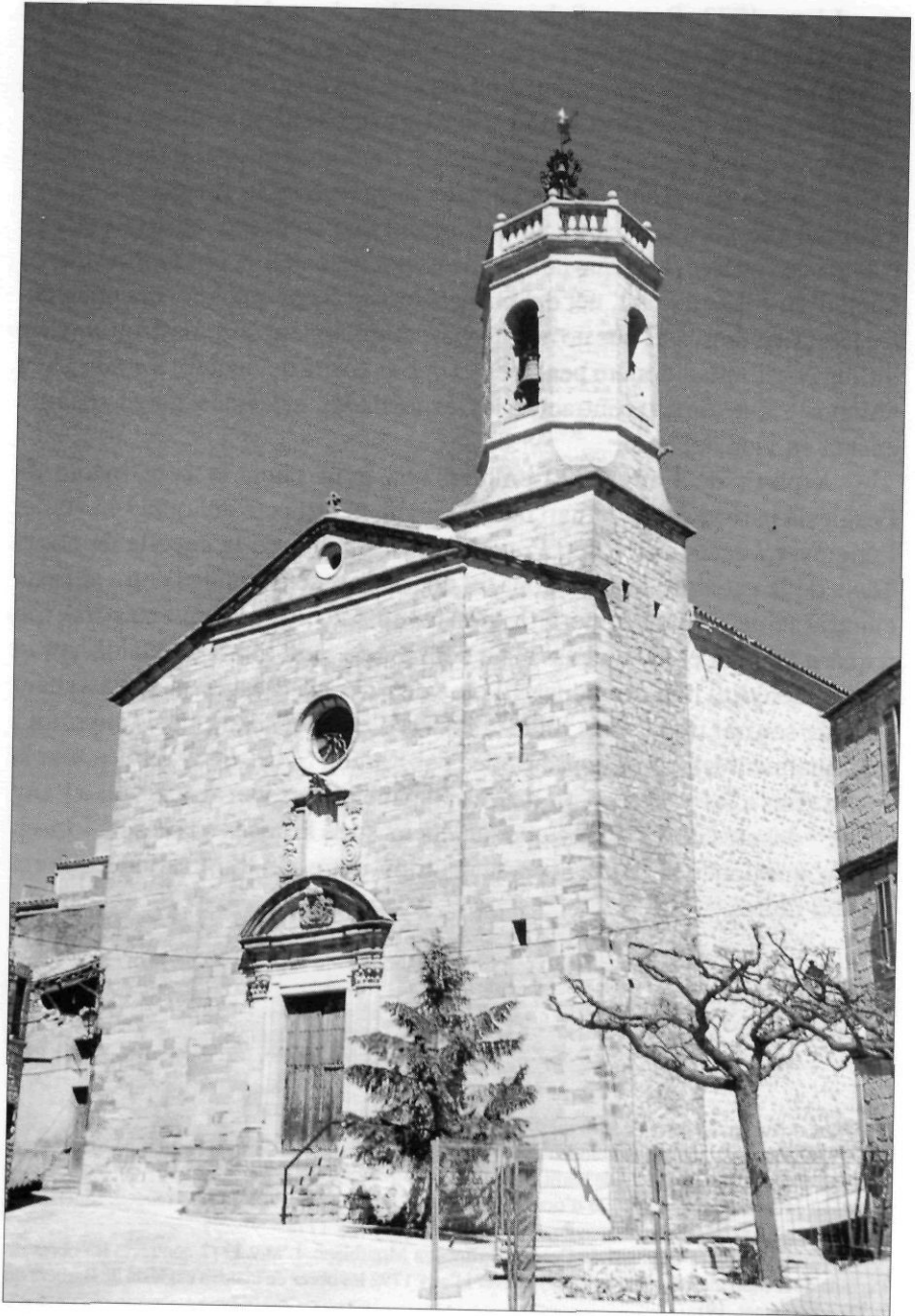
Església parroquial i santuari de la Mare de Déu de Passanant.