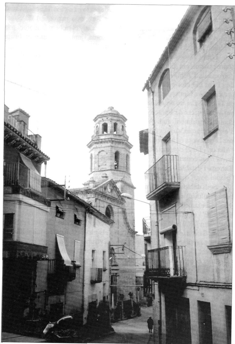
Església parroquial de l'Albi (Garrigues).