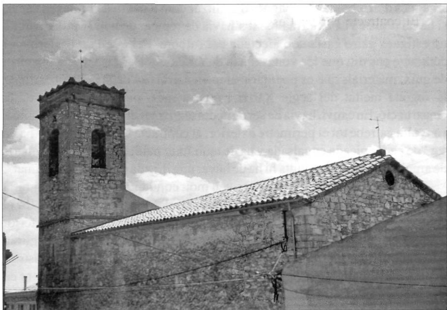
Savallà del Comtat: església de Sant Pere i campanar.