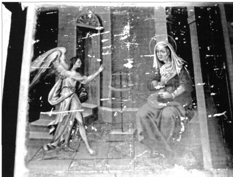
Foto 3. Anunciació a santa Anna, del carrer lateral del retaule de Santa Anna

ta in dicta ecclesia sancte Magdalene sub invocatione Transfiguracionis Domini nostri Jesuchristi alias sanct Salvador, de qua invocatione est beneficium fundatum in dicta capella, sub pactis et conditionibus sequentibus, videlicet: