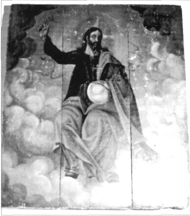
Foto 1. Taula de Sant Salvador conservada a la plebania de Montblanc