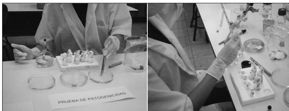
Figura 3 Prueba de patogenicidad.