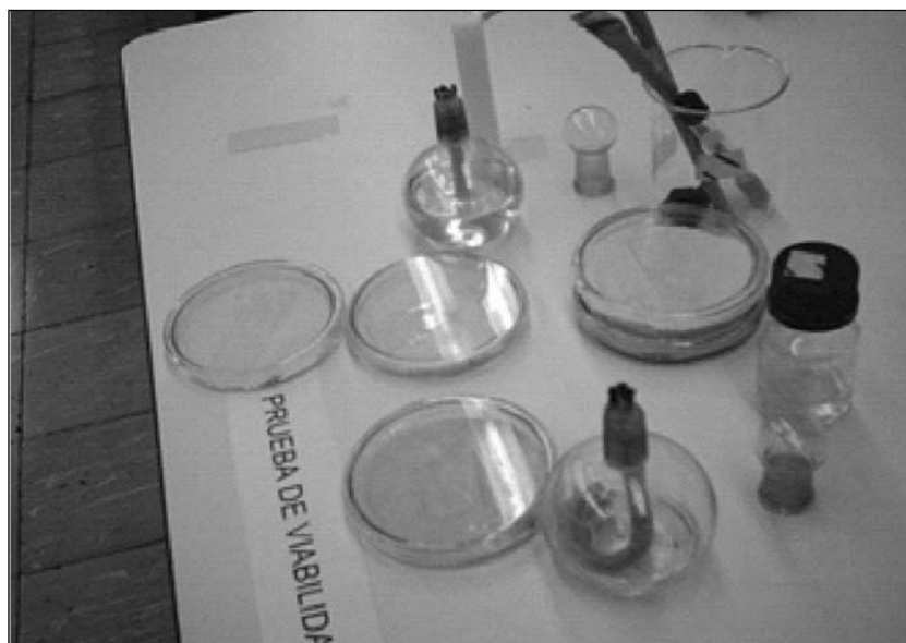
Figura 4 Prueba de viabilidad del hongo entomopatógeno M. anisopliae realizado en los laboratorios de microbiología de la Universidad de San Buenaventura- Cali