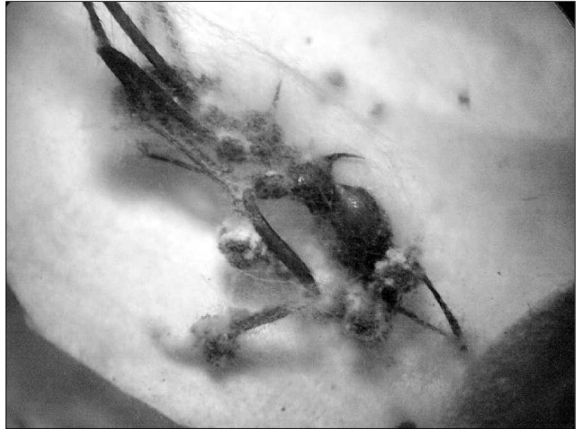
Foto tomada de estereoscopio a 40X, Universidad San Buenaventura-Laboratorio de Microbiología.