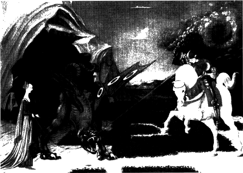
San Xurxo liberando a princesa. Ucello

En experiencias sucesivas, os alumnos buscaron a música máis concorde cos debuxos realizados por eles mesmos; ou, noutro caso, a partir dun fragmento musical, eles fixeron os seus propios debuxos.