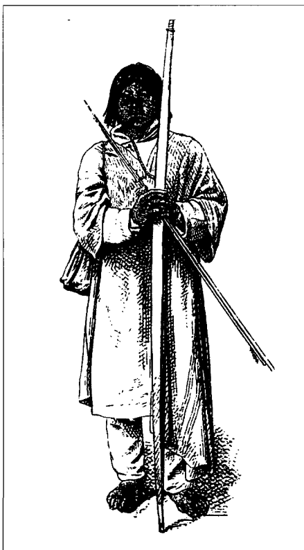
Campa vestido en parte con ropa europea y en parte con ropa tejida por su tribu (armas indígenas) in Wiener, p. 374

1975b "Male/female relations and the organization of work in a Machiguenga community", American Ethnologist , II (4) : 634-648.