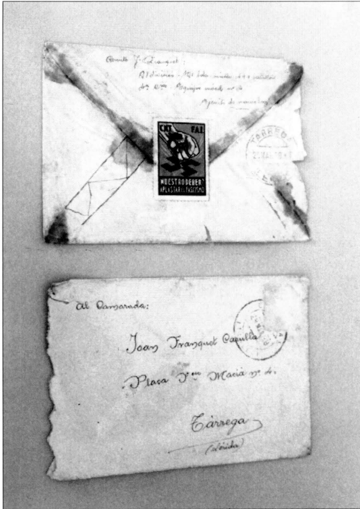
Les dues cares dels sobres de les cartes de Josep Franquet i Corbella. Observem els expressius segells de la CNT - FAL. (Fotografies: Oriol Saula).