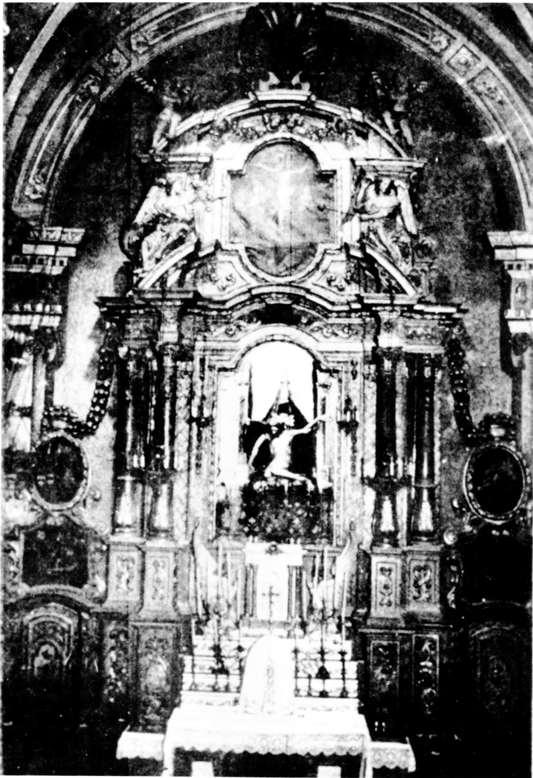
1. Retaul de la capella dels Dolors de l'església parroquial de Tàrraga, destruït el 1936. Fotografia treta del llibre de Lluís Sarret: La venerable Congregació de la Mare de Déu dels Dolors de Tàrraga . Tàrraga, 1935. (Reproducció: Jesús Vilamajó).