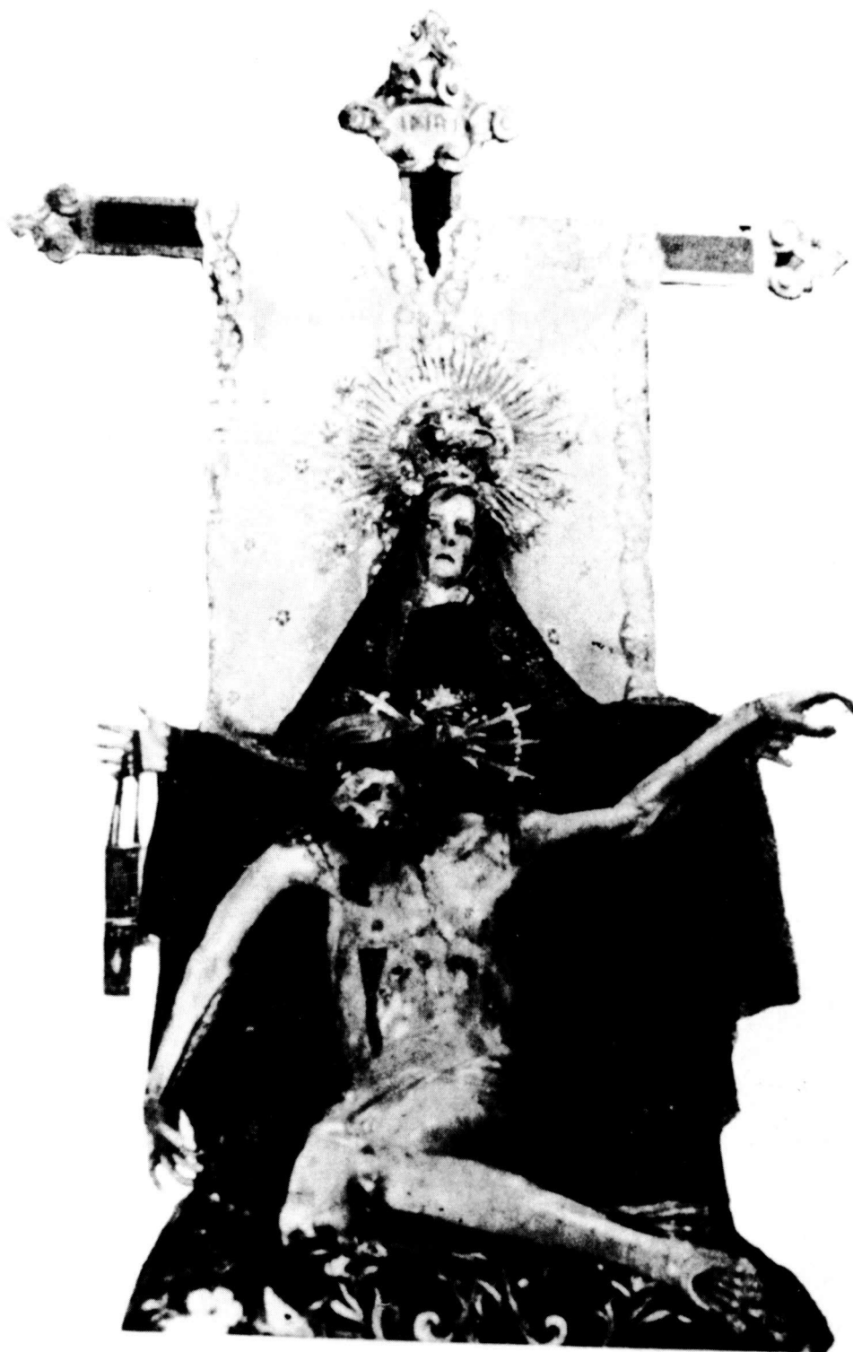
2. Detall de la imatge dels Dolors del llibre de Lluís Sarret ja esmentat..