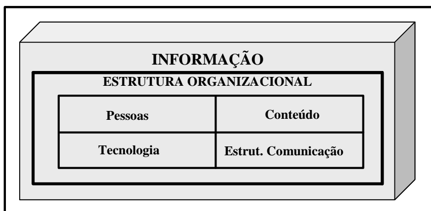
FIGURA 03 – Componentes da estrutura informacional

Ampliando a proposta do modelo – estrutura informacional - sugere-se a incorporação do conteúdo. O conteúdo da informação depende de vários fatores relacionados entre si, os quais podem ser: i) o tipo da informação; ii) a origem da informação; iii) o papel da informação; iv) a utilidade da informação e, por fim, v) o processamento da informação. E, como observado anteriormente, há ainda o fator cognitivo, que permeia todos estes outros fatores. De posse dos conceitos e da síntese dos trabalhos já realizados pelos autores citados, este trabalho apresenta, a título de discussão, um esquema que retrata os componentes da estrutura informacional, representado pela figura 03, abaixo.