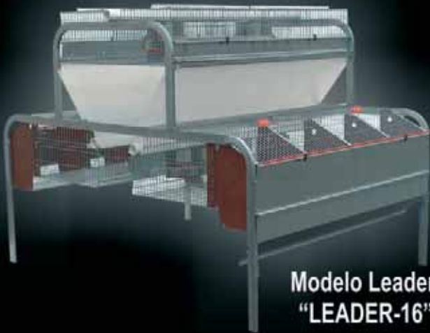
Modelo Leader "LEADER-16"

SERVICIO, INNOVACIÓN Y DISEÑO AL SERVICIO DEL CUNICULTOR