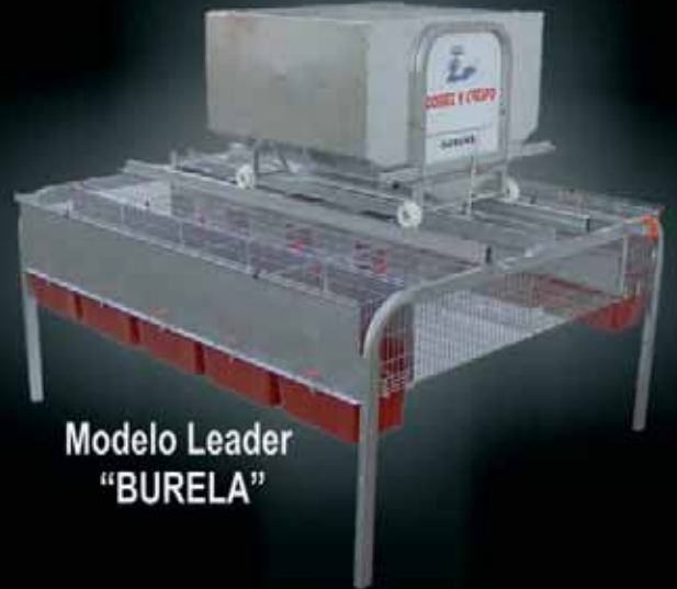
Modelo Leader "BURELA"