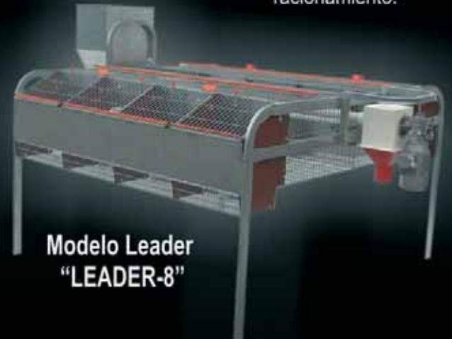
Modelo Leader "LEADER-8"