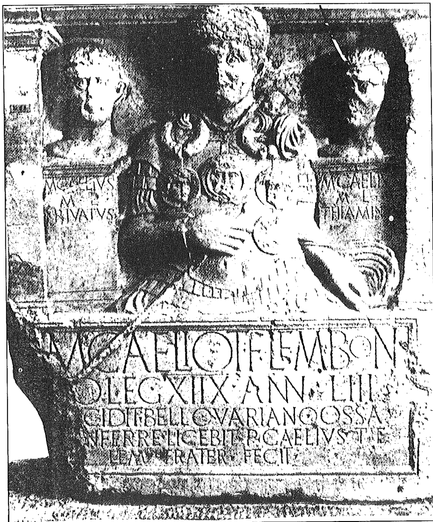
Figura 5. Estela funeraria de Marcus Caelius, centurión de la legión XVIII, muerto en el desastre de Varo de 9 d.C. Fue levantada en Vetera (Alemania). En él se representa al centurión muerto con sus condecoraciones militares, entre ellas un juego de fáleras. (Tomado de MAXFIELD, 1981, pl. 2).

la recibía quedaba convertido en piedra (GRIMAL, 1991: 217-218). Las representaciones artísticas clásicas no siempre fueron tan fieles a tal imagen (basta contemplar la llamada «Medusa Rondanini» que se conserva en la Gliptoteca de Munich).