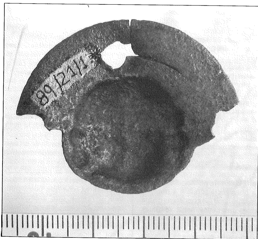
Figura 2. Reverso de la fálera del Museo de Priego.

jeto que describimos. Aparentemente la pieza posee en su parte superior un orificio claro, así como otros dos a ambos lados. Estos laterales no conservan todo su perímetro debido a que la parte perdida de la pieza comenzaría