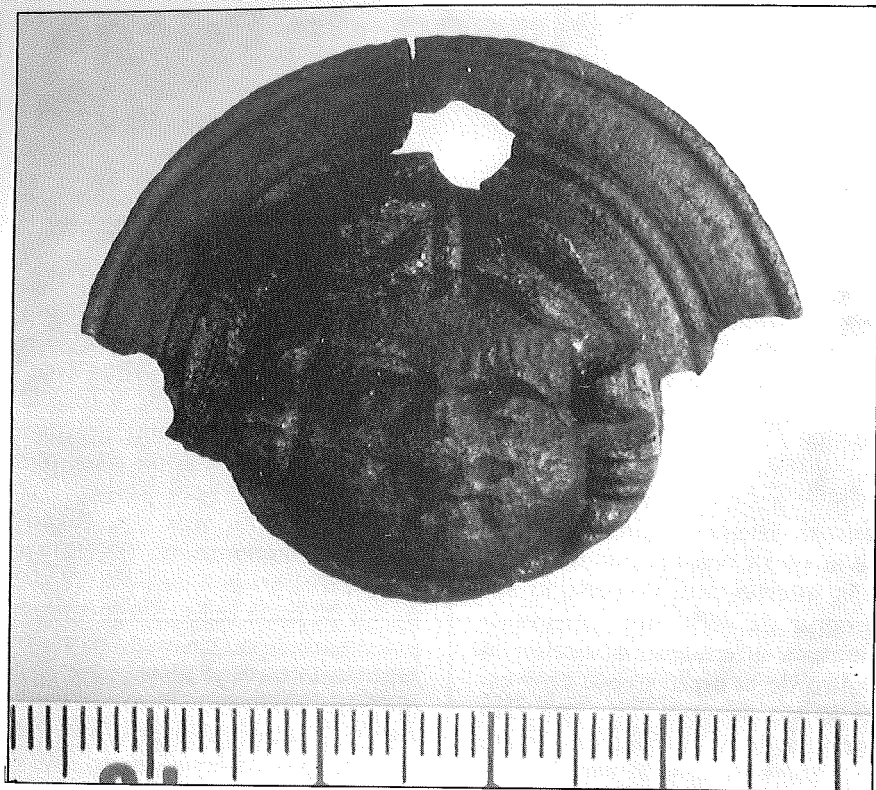
Figura 1. Anverso de la fálera del Museo de Priego.