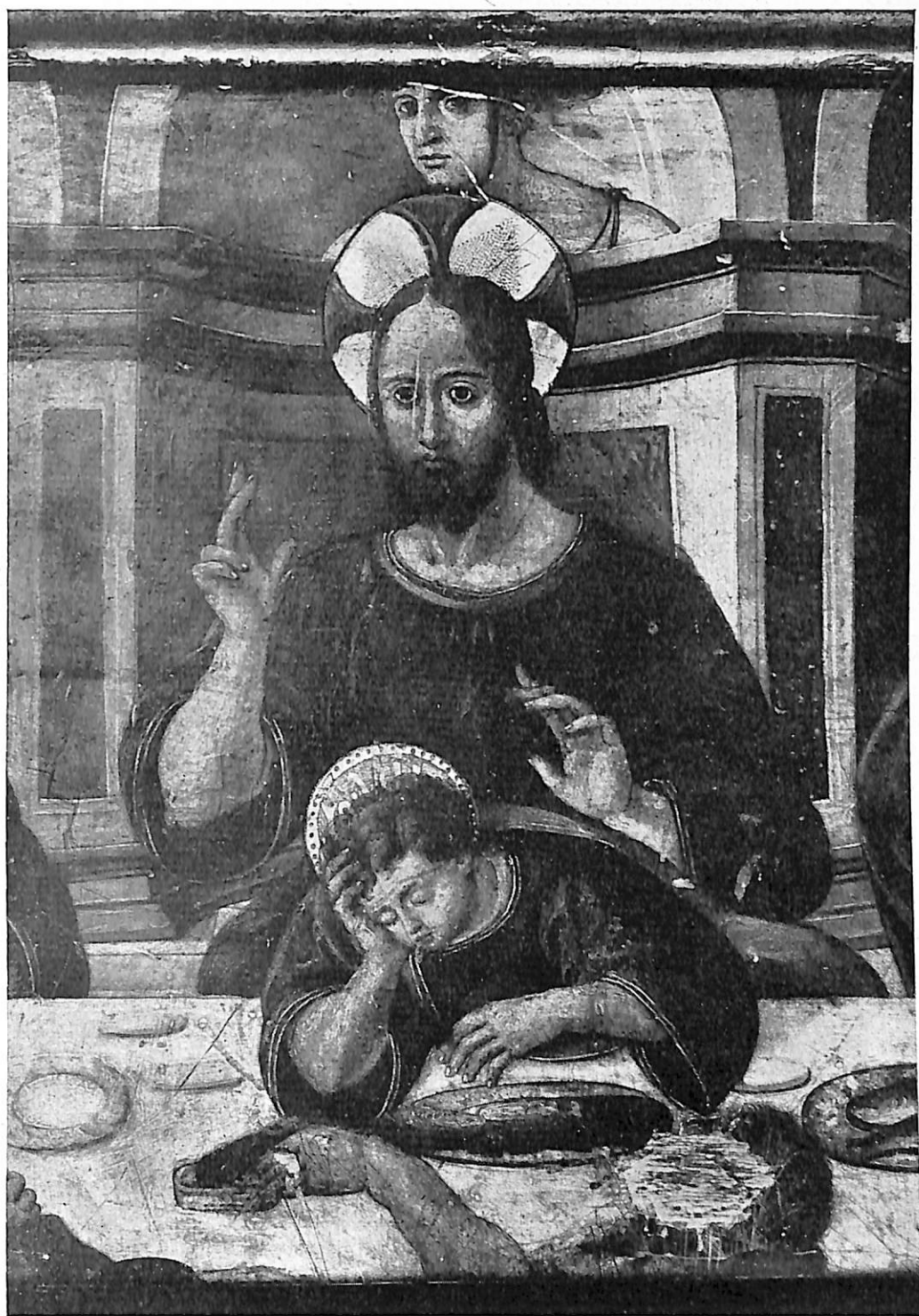
LÁMINA III. — Pormenor de la tabla de la Cena en la Colegiata de Ampudia (Palencia).