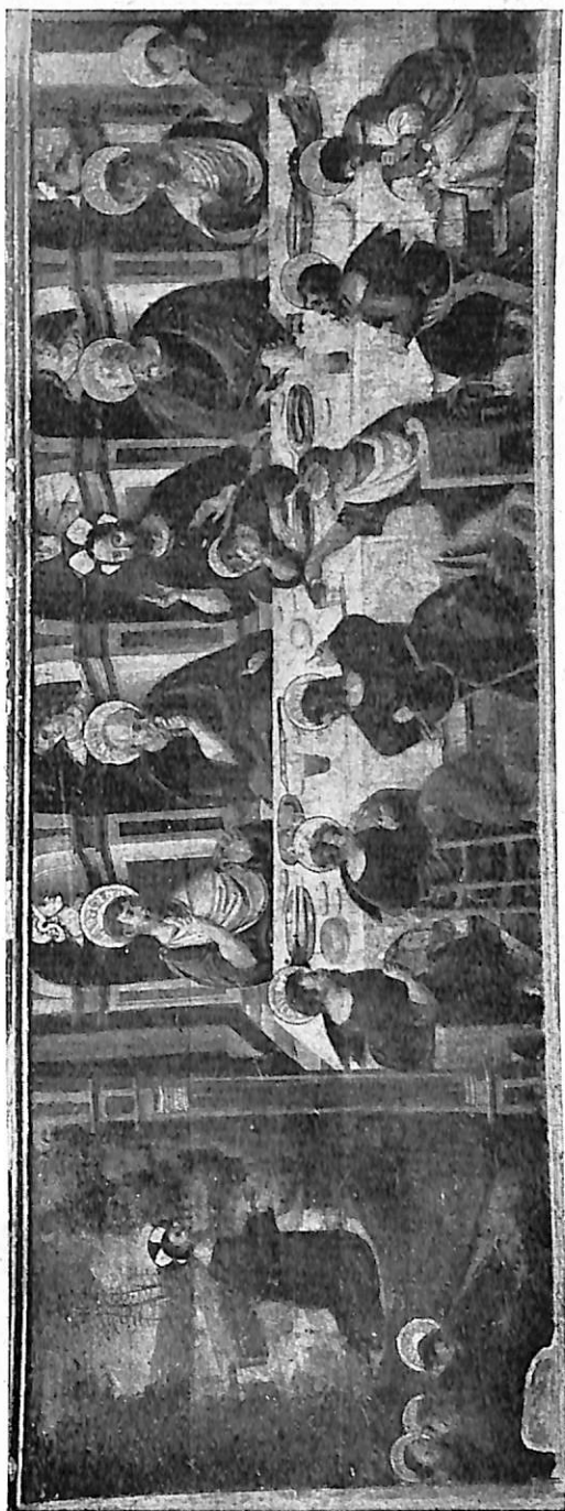
LÁMINA I. — Tabla de la Cena. En la Colegiata de Ampudia (Palencia).