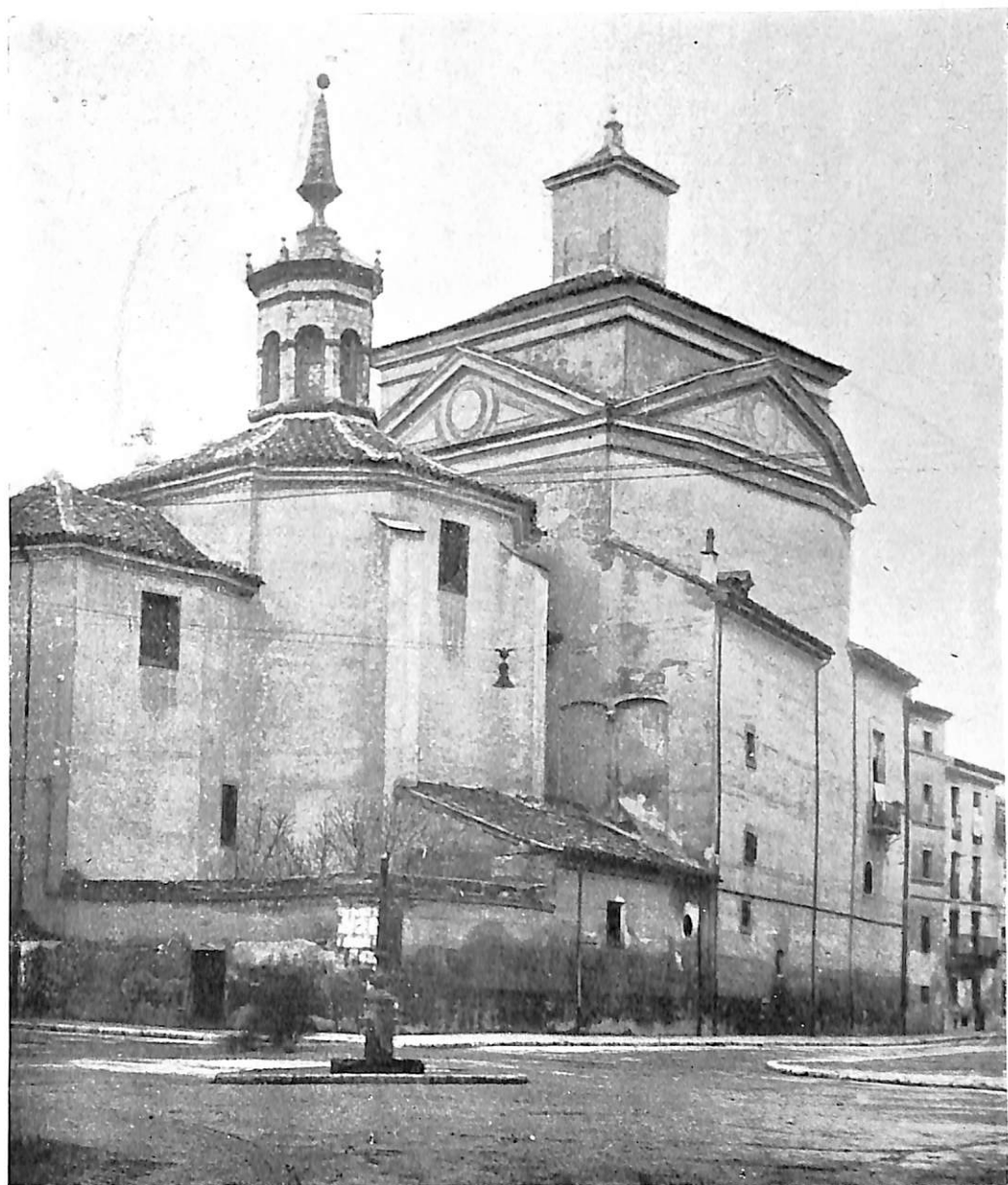
Lám. I.—Abside de la Penitencial de Nuestra Señora de las Angustias; en el primer término a la izquierda, la capilla donde se venera la Virgen de los Cuchillos.