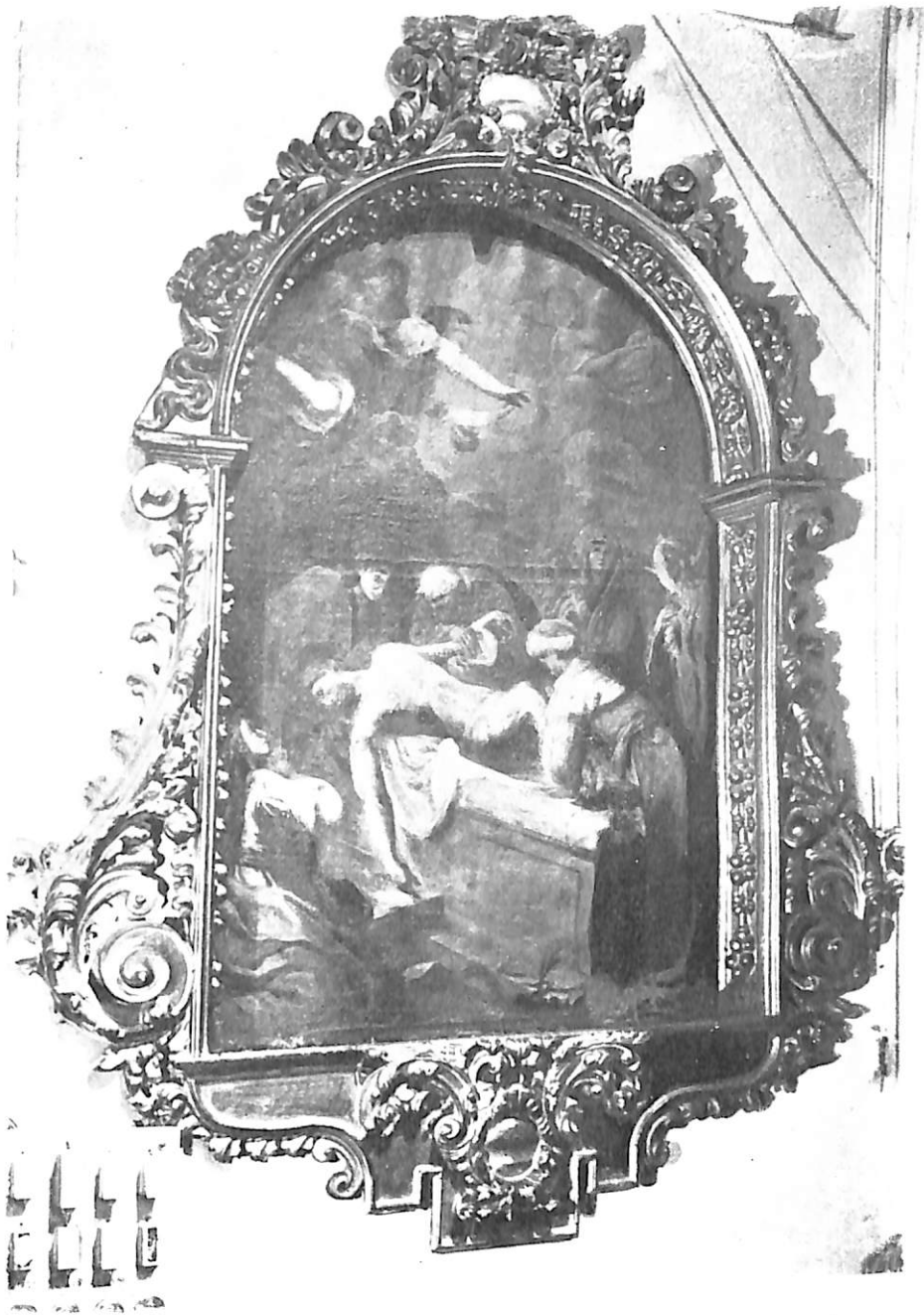
Lám. IV.—Capilla de Nuestra Señora de las Angustias. Cuadro «El entierro de Cristo» de Manuel Peti