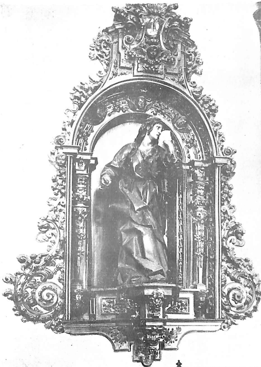
Lám. II.—Capilla de Nuestra Señora de las Angustias. Hornacina barroca, con la Magdalena de Gregorio Fernández.