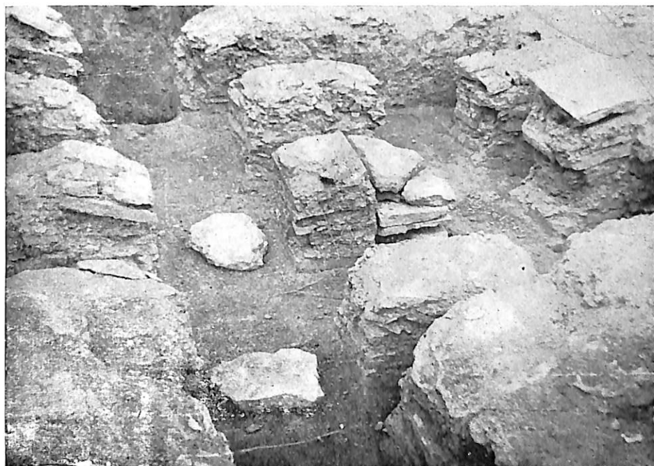
LÁMINA I. Excavaciones de la Granja José Antonio. Hipocaustum primero y segundo.