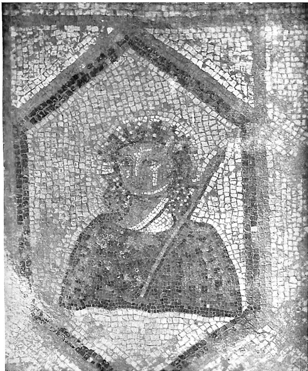
LÁMINA IV. Figura del mosaico del Santuario. (Parte superior derecha del espectador).