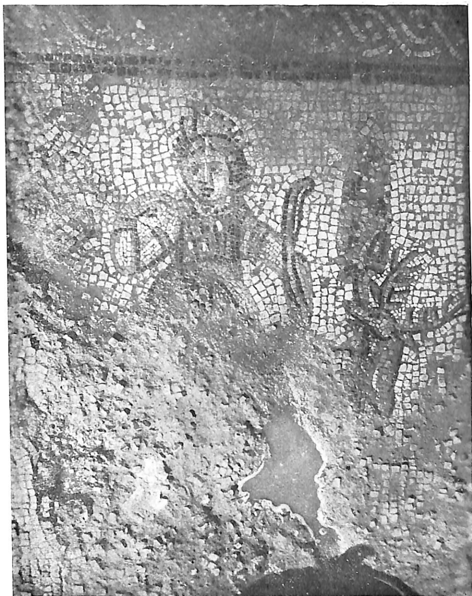
LÁMINA III. Figura central del mosaico del Santuario.