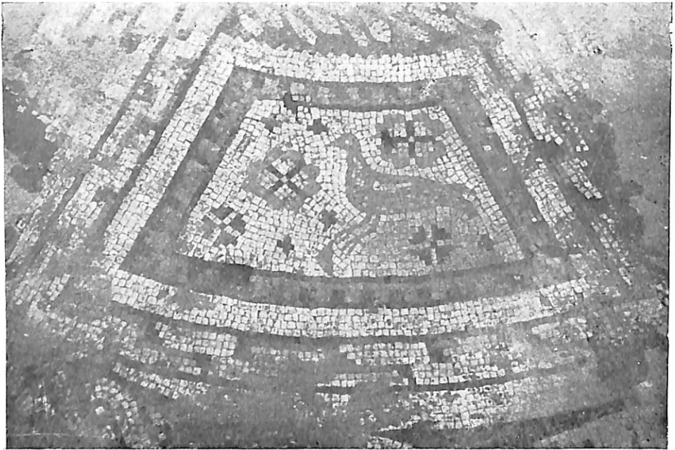
LÁMINA II. Mosaicos de la Villa Romana.