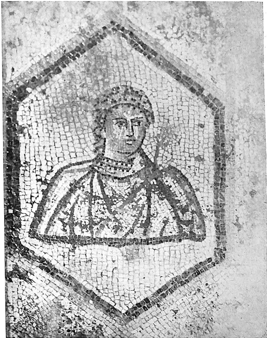
LÁMINA V. Figura del mosaico del Santuario (Parte inferior izquierda del espectador).