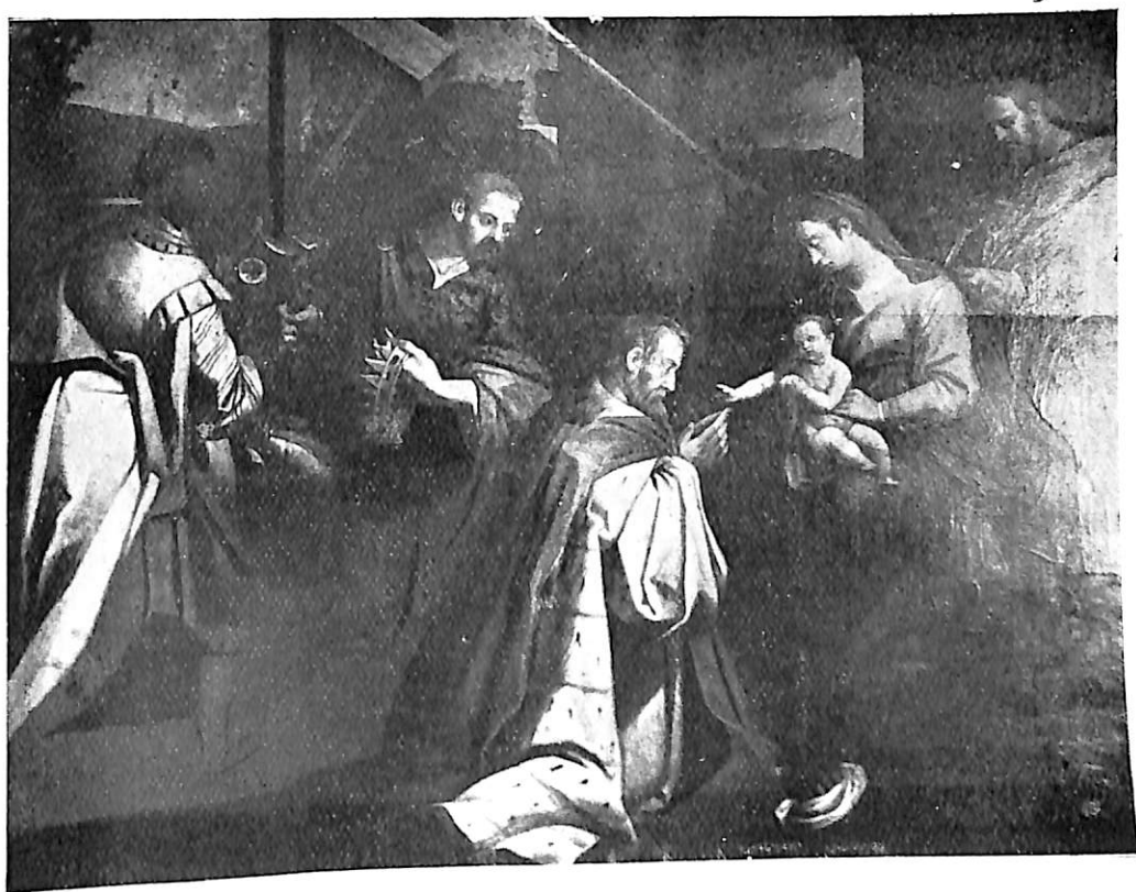
4 y 5. Nacimiento y Adoración de los Reyes, por Gregorio Martínez, Valladolid, Colección Finat Calvo.