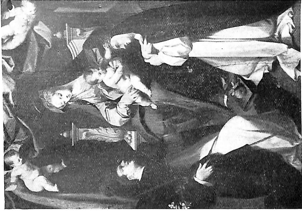
2 La Virgen con Santo Domingo y Santa Catalina, por Gregorio Martínez. Colección Finat Calvo.