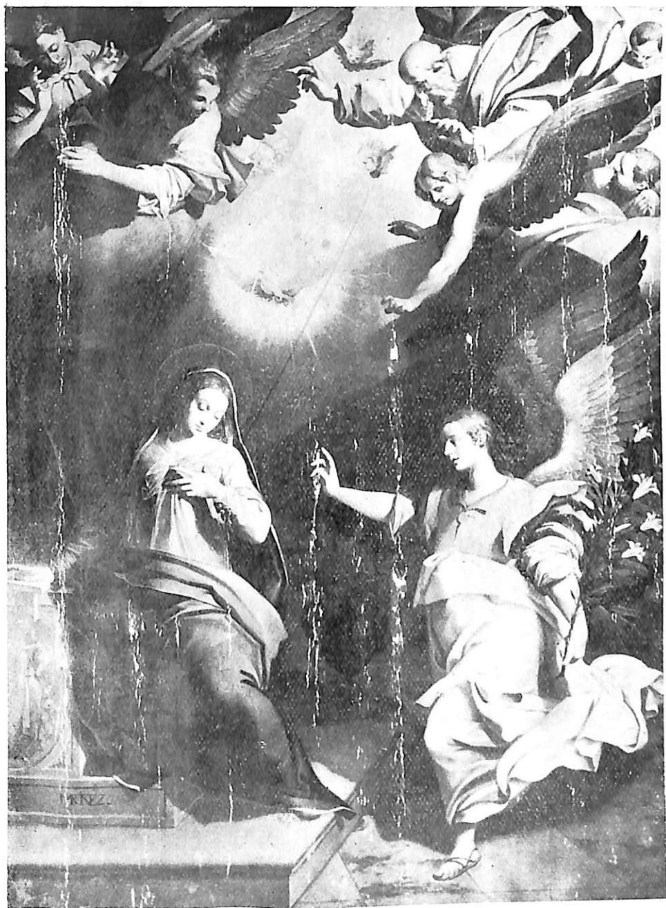
3. Valladolid. Museo Nacional de Escultura. Anunciación, por Gregorio Martínez.