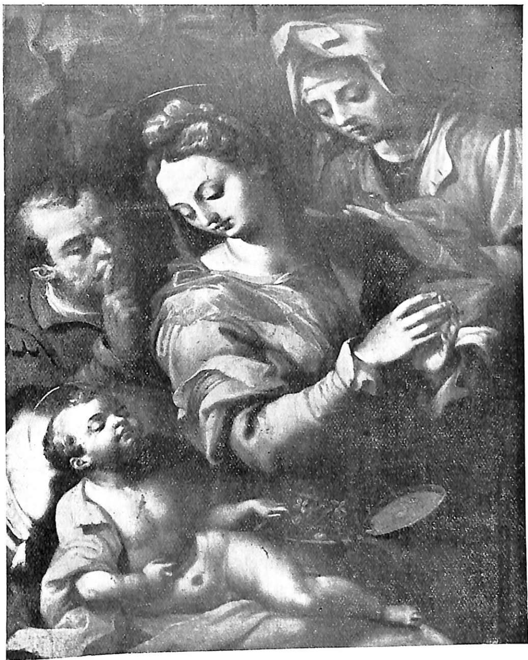
6. La Virgen con Santa Ana y San José, contemplando al Niño, por Gregorio Martínez. Colección Finat Calvo, Valladolid.