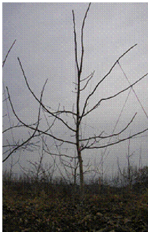
Figura 2- Sistema ECL+a