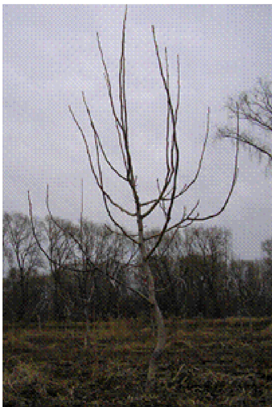
Figura 1- Sistema ECL

Valores seguidos de igual letra no difieren estadísticamente (Duncan 0.05)