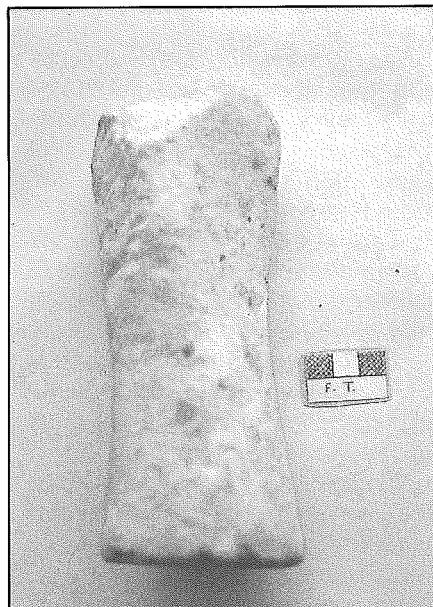
Lámina 3. Ídolo, cara B.

sentado en ambas caras los miembros, tampoco se ha indicado el sexo, a no ser que en su momento estuviesen pintados, detalle que no nos ha llegado.