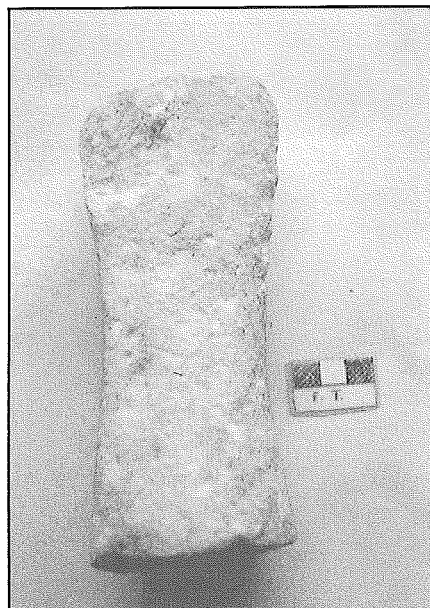
Lámina 2. Ídolo, cara A.

9 cms. de largo. Corresponde al tronco y extremidades inferiores, ambos simulando estar cubiertos con un refajo o enaguas con tres pliegues. La banda derecha (de 1'6 cms. de anchura) está recorrida verticalmente por una línea en zigzag, rasgo que no se aprecia en las demás bandas. Éstas se distinguen por dos protuberancias convexas: la central, de aspecto trapezoidal (B.M. = 3'5, b.m. = 1'5 cms. respectivamente), y la izquierda rectangular, semejante en dimensiones a la de la derecha. En la cara opuesta (fig. 1, B, lám. 3) sólo se observa el ojo de la parte derecha de la cara y la nariz (igualmente en ángulo triedro), el resto de los adornos faltan por fractura antigua. En esta parte no se perciben los pliegues del vestido. No se han repre-