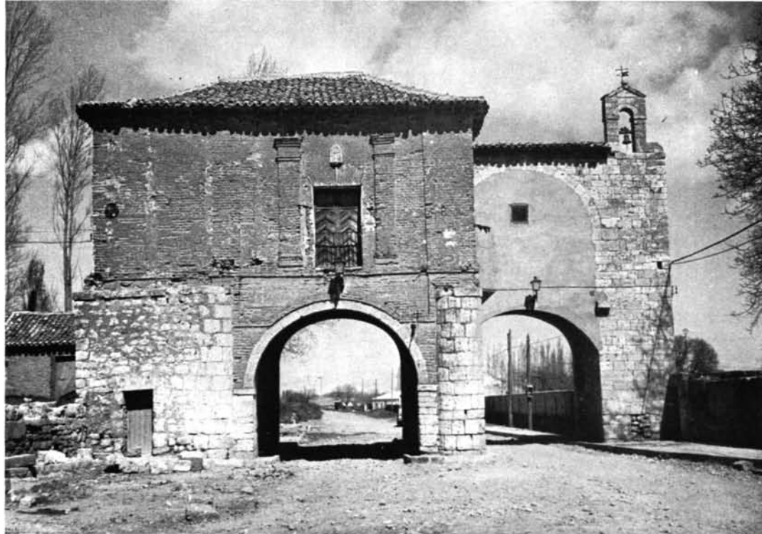
Medina de Rioseco (Valladolid). Puerta de San Sebastián: 1. Fachada principal.—2. Fachada posterior.