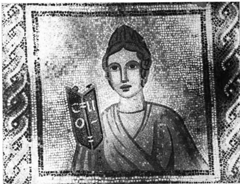
Moncada (Valencia). Detalles del mosaico con representación de las Nueve Musas: 1. Terpsicore.—2. Clio.