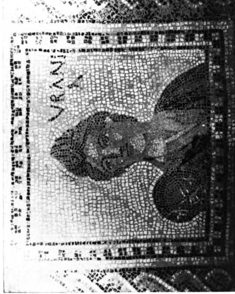
Moncada (Valencia). Detalles del mosaico con representación de las Nueve Musas: 1. Polymnia.—2. Urania.