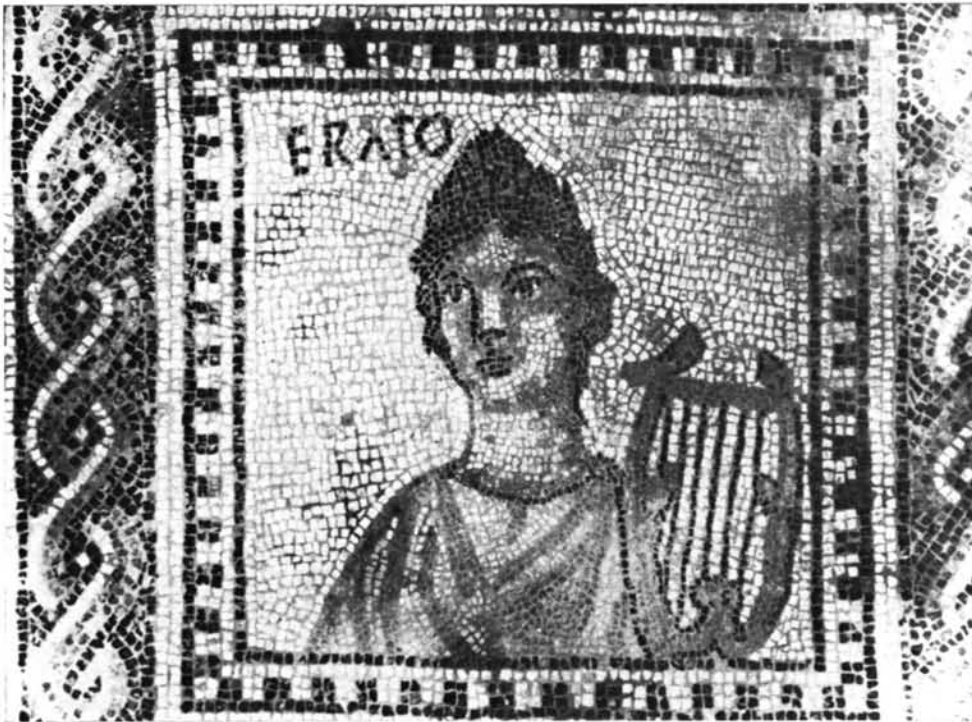
Moncada (Valencia). Detalles del mosaico con representación de las Nueve Musas: 1. Calíope.—2. Erato.