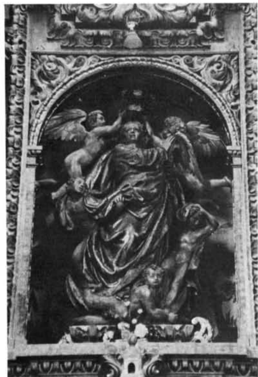
Villahizán de Treviño (Burgos). Iglesia parroquial: 1, 2, 3 y 4. Conjunto y detalles del retablo mayor.