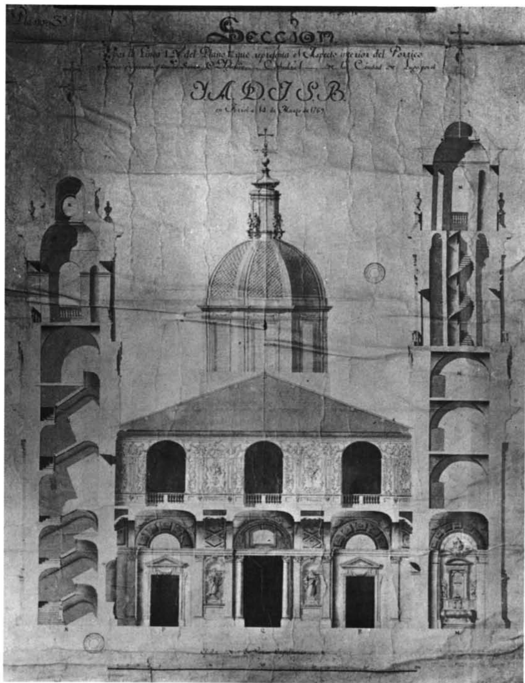
Lugo. Catedral. Sección interior, por Julián Sánchez Bort.