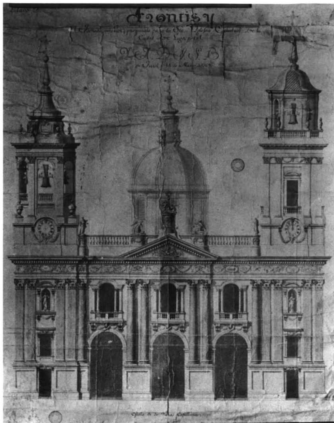
Lugo. Catedral. Alzado de la fachada principal, por Julián Sánchez Bort.