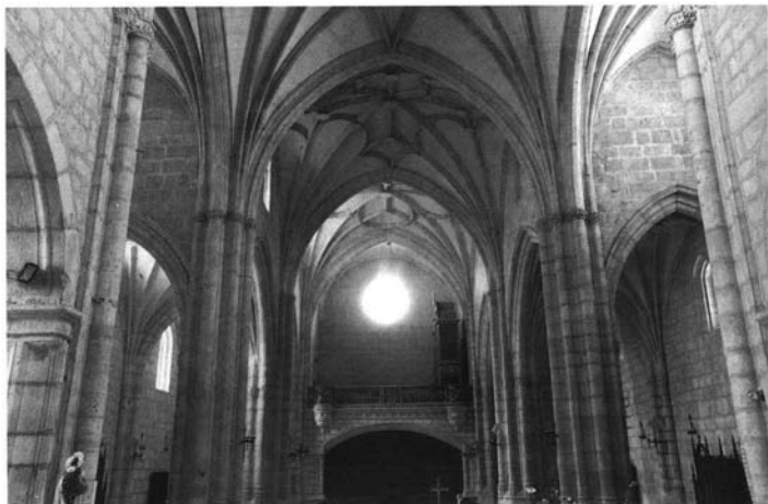
Tórtoles de Esgueva. Dos aspectos del interior de la iglesia parroquial.