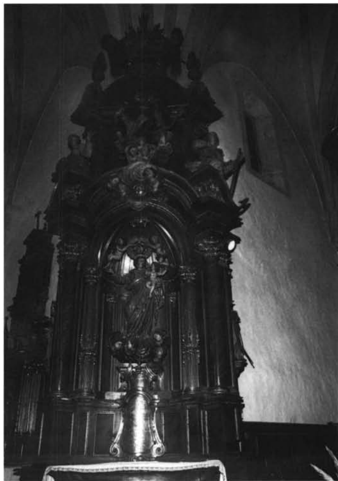
1. Gaviria. Iglesia de Santa María. Retablo mayor.—2. Cegama (Guipúzcoa). Iglesia de San Martín. Retablo de Nuestra Señora del Rosario.