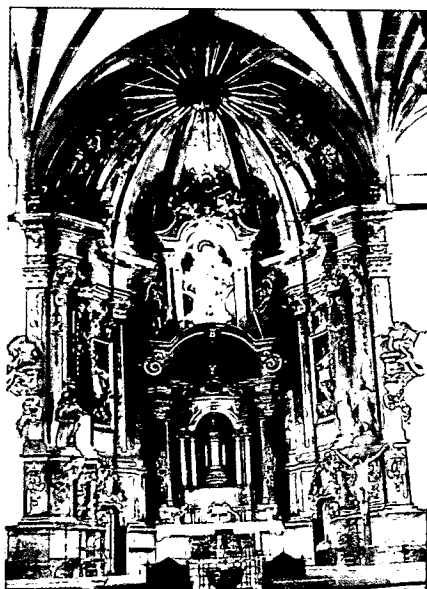
1. Segura (Guipúzcoa). Iglesia de Santa María. Retablo del Crucifijo.—2. Zumárraga (Guipúzcoa). Iglesia de Santa María. Retablo mayor.