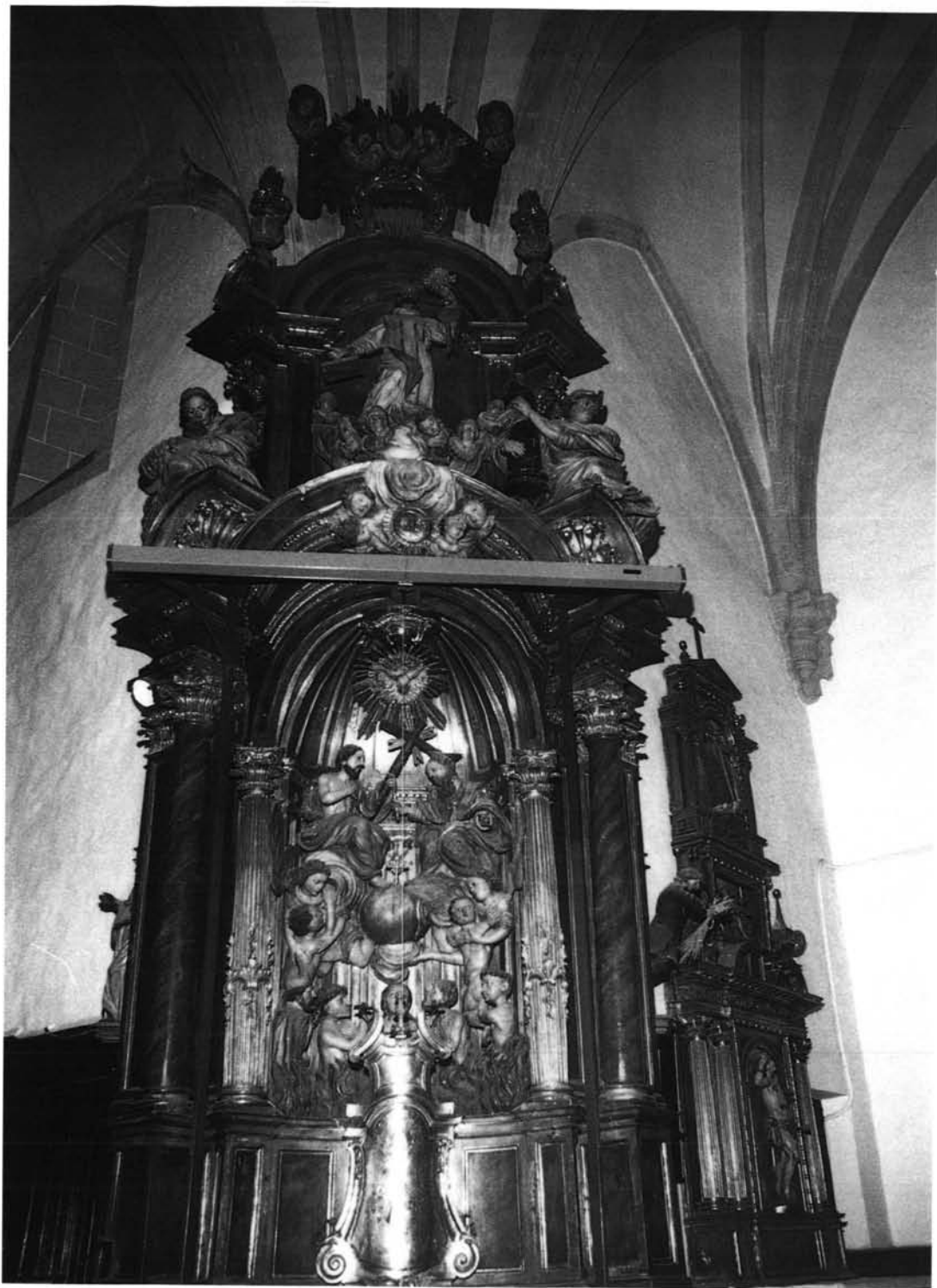
Cegama (Guipúzcoa). Iglesia de San Martín. Retablo de las Benditas Animas.