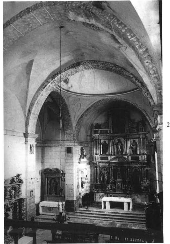
1. La Revilla de Soba (Cantabria). Planta de la iglesia parroquial.—2. Interior del templo.