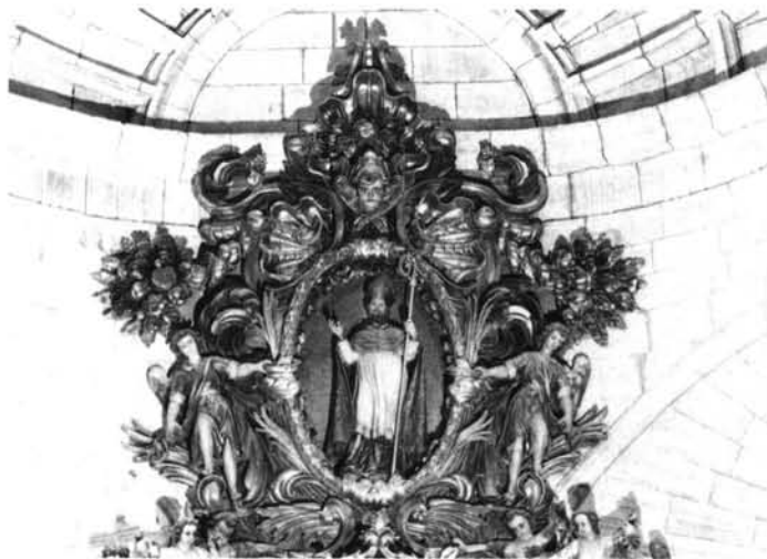
Orio (Guipúzcoa). Iglesia parroquial. Retablo mayor. Atico.