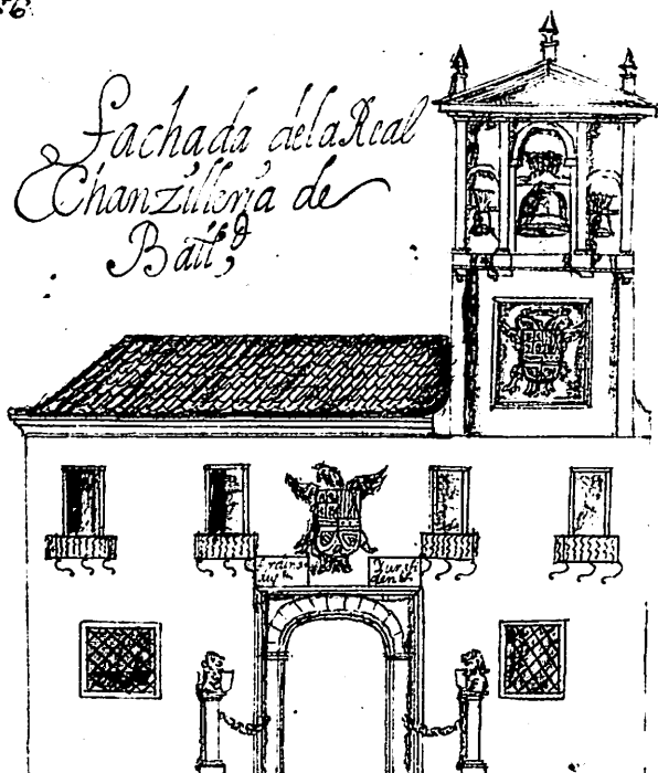
Valladolid. Palacio de los Vivero. Dibujo que figura en el ejemplar de la Historia de Valladolid , de Antolínez de Burgos, en la Biblioteca Nacional.