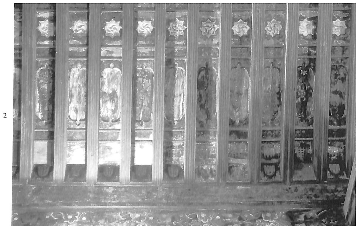
Valladolid. Palacio de los Vivero. 1. Artesonado de la Sala Rica.—2. Detalle del artesonado.