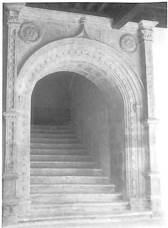
Valladolid. Palacio de los Vivero. 1. Fachada principal despues de la restauración de 1992.— 2. Cuerpo inferior de la torre.—3. Escalera.