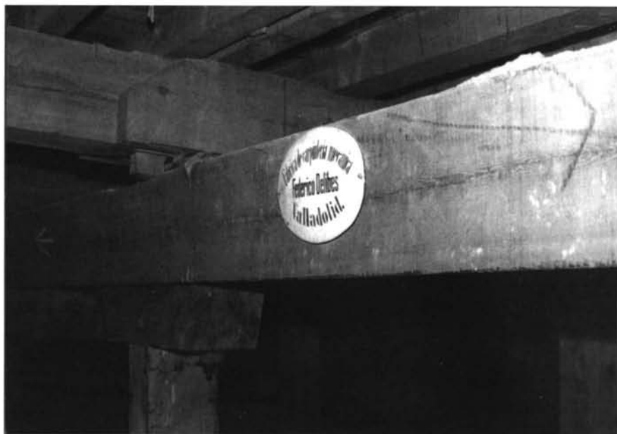
Valladolid. Teatro Calderón. Sistema de sostenimiento del patio de butacas. Carpintería mecánica. Federico Delibes.