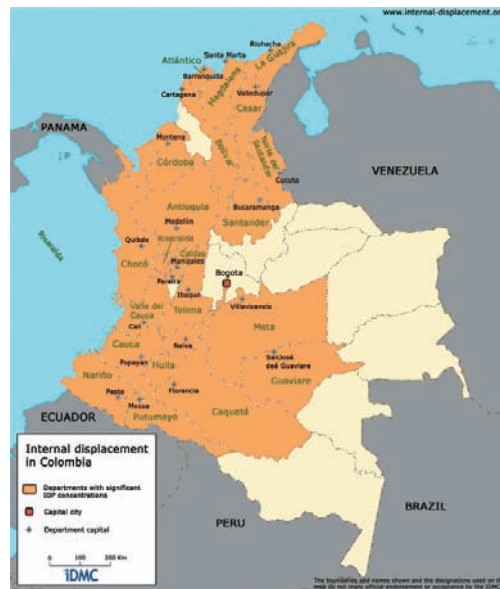
Mapa 2. Localización del desplazamiento interno en Colombia. 2005

No obstante, existen departamentos que por su características geoestratégicas resultan tener un mayor protagonismo. Así, en cuanto al mayor volumen de personas desplazadas destacan siete (7) de los treinta y dos (32) 16 departamentos en que se divide el país. Cada uno de ellos representa más de un 5% del total de desplazados durante el período analizado (2003-2007), en total el 30,2%; y son por este orden: Antioquia, seguido de Caquetá, Bolívar, César, Tolima y Meta.