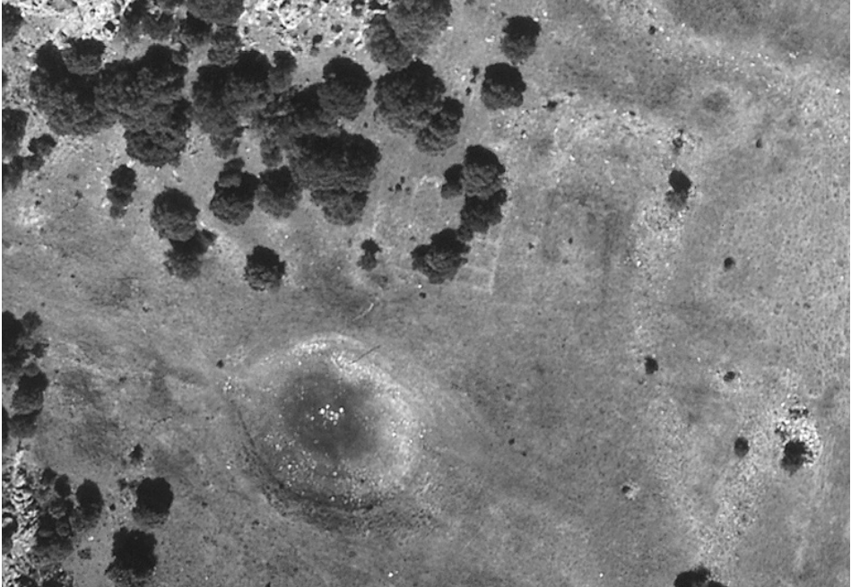
Fig. 1. Castro de Las Labradas (Arrabalde). Zona en las inmediaciones del Pozo de Negrura.

un claro cono de deyección, en el que se abrieron en la antigüedad una serie de grandes estanques o aljibes, muy posiblemente destinados a la captación y almacenamiento de las aguas procedentes de lluvias y nieves. Estos aljibes son conocidos con los nombres de Laguna del Sol, Laguna Menta, Campo de Deportes y Pozo de Negrurías. Éste último es el de mayores dimensiones y es el único del que se ha podido verificar sus características como estanque para el agua puesto que durante muchos años se ha llenado en épocas invernales y ha mantenido el agua en su interior durante importantes periodos de tiempo. Por último, entre las lagunas del Sol y Menta se puede observar una importante acumulación de piedras conocida por las gentes del lugar como la Casa del Jefe.