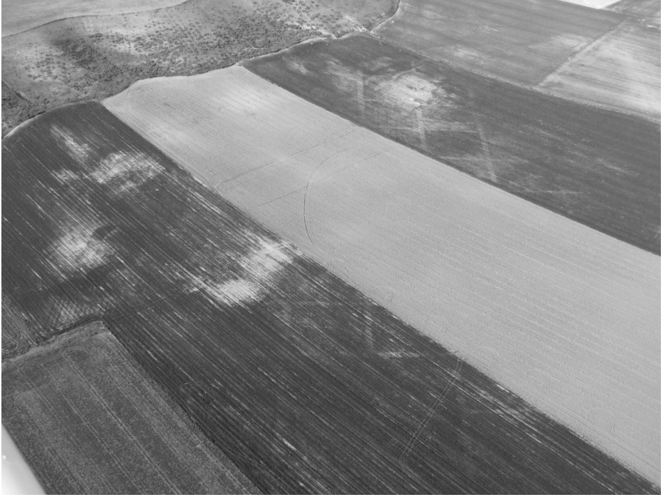
Fig. 4. Molacillos. Alineamientos en retícula de probable trama urbana.