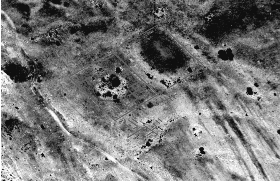
Fig. 2. Conjunto de edificaciones. Casa del Jefe y Campo de Deportes.