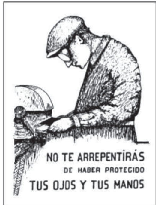
Figuras 1 y 2. Carteles dirigidos al obrero (Negativo y positivo).