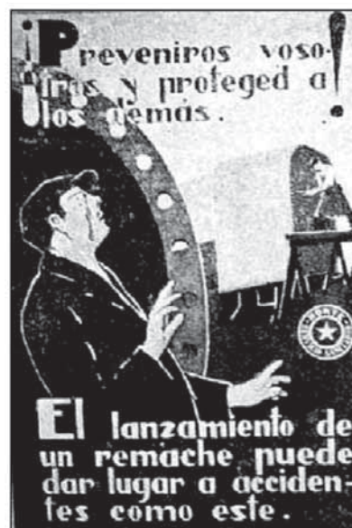
Figuras 9 y 10. Carteles pintados por E. Menager y diseñados por Vicente Andrés para la Compañía de Ferrocarriles del Norte.