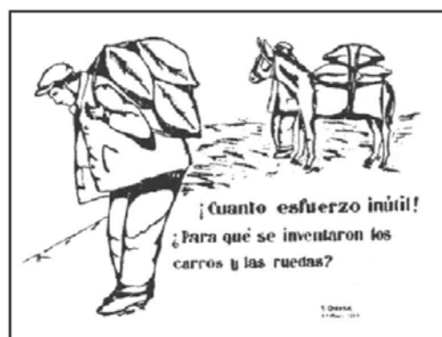
Cartel del IRPIT elaborado por reeducandos.