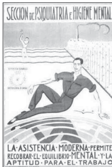
Cartel elaborado por Poly para la Dirección General de Sanidad.