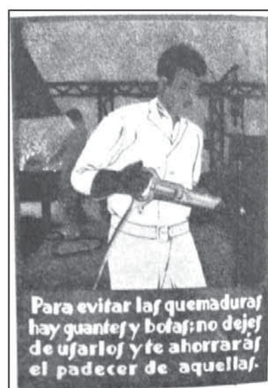
Figuras 15 y 16. Carteles del IRPIT realizados por iniciativa de la Oficina-Laboratorio de Orientación profesional de Sevilla.