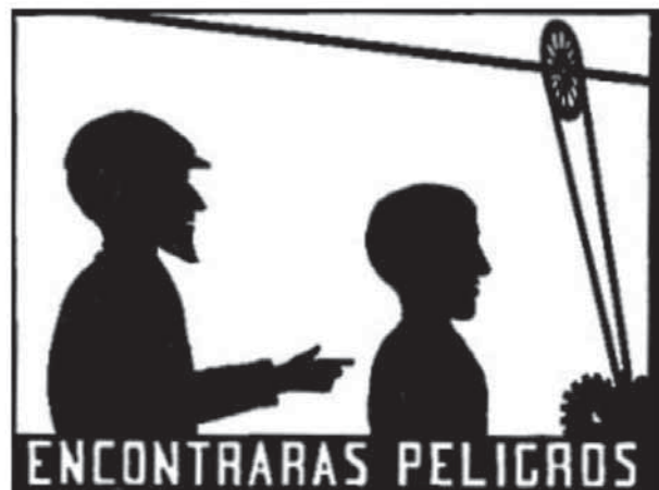
Figuras 13 y 14. Carteles diseñados para un experimento realizado por Mallart, 1935.