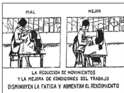
Dibujo realizado por la Secretaría del Comité Nacional de OCT para la casa Michelin.