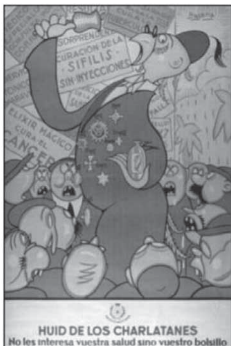
Cartel elaborado por Bagaría para la Dirección General de Sanidad.