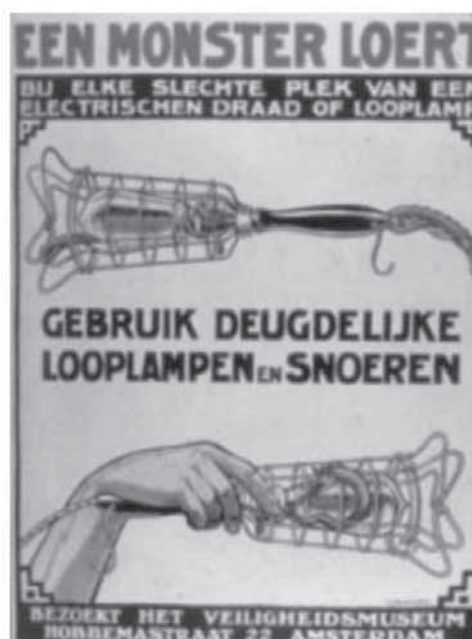
Figuras 11 y 12. Cartel del Instituto de Reeducción Profesional adaptado de uno holandés.