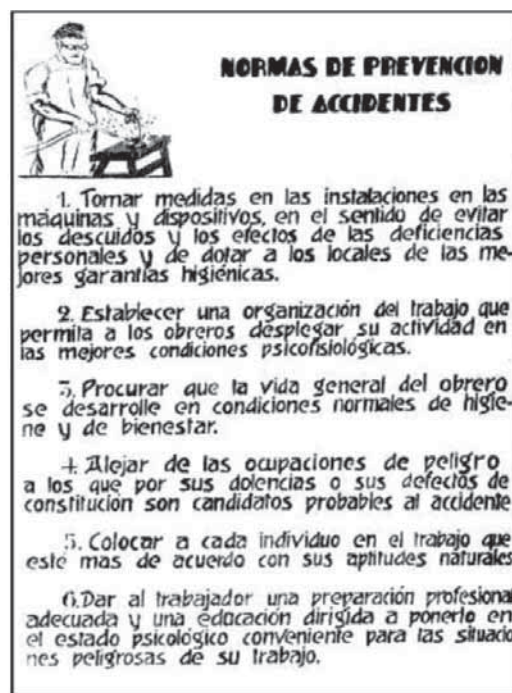
Cartel del Instituto de Reeducación de Inválidos, elaborado por un reeducando.