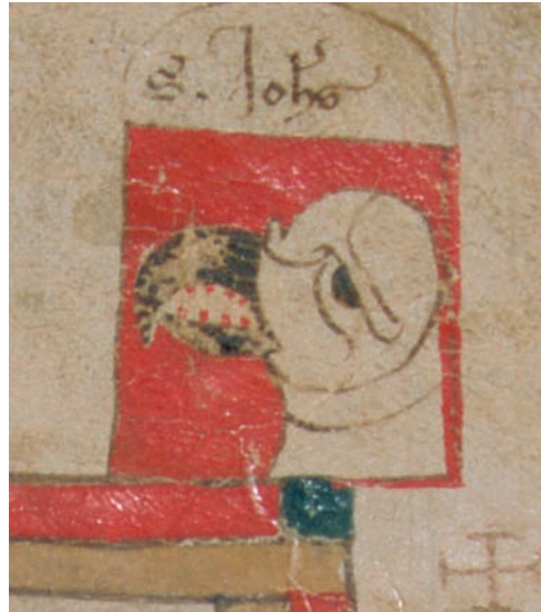
Imatges de detall de cadascun dels animals simbòlics que representen els quatre evangelistes: sant Mateu, sant Joan, sant Lluç i sant Marc.