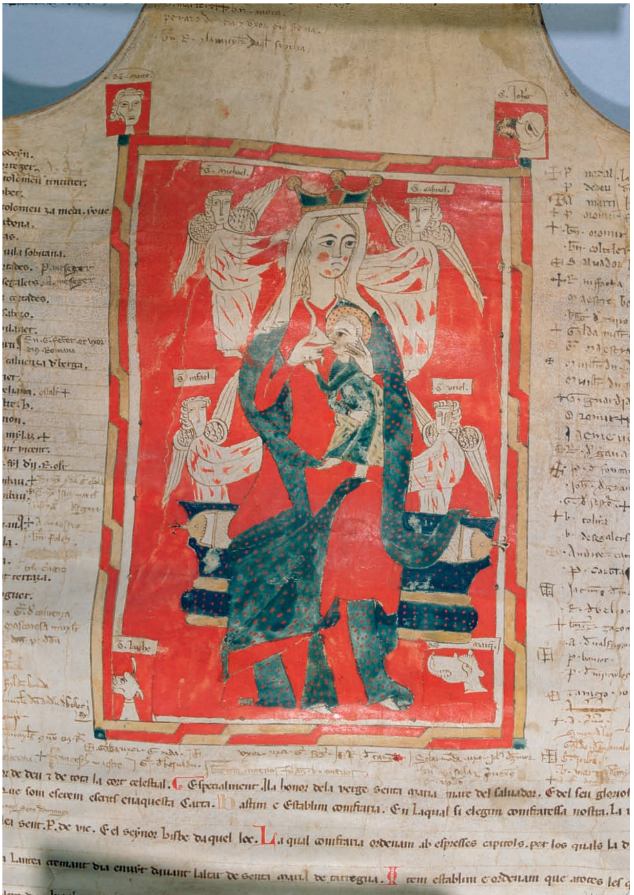
Detall general de la miniatura del pergami de la fundació de la confraria dels mercaders de Tàrraga.