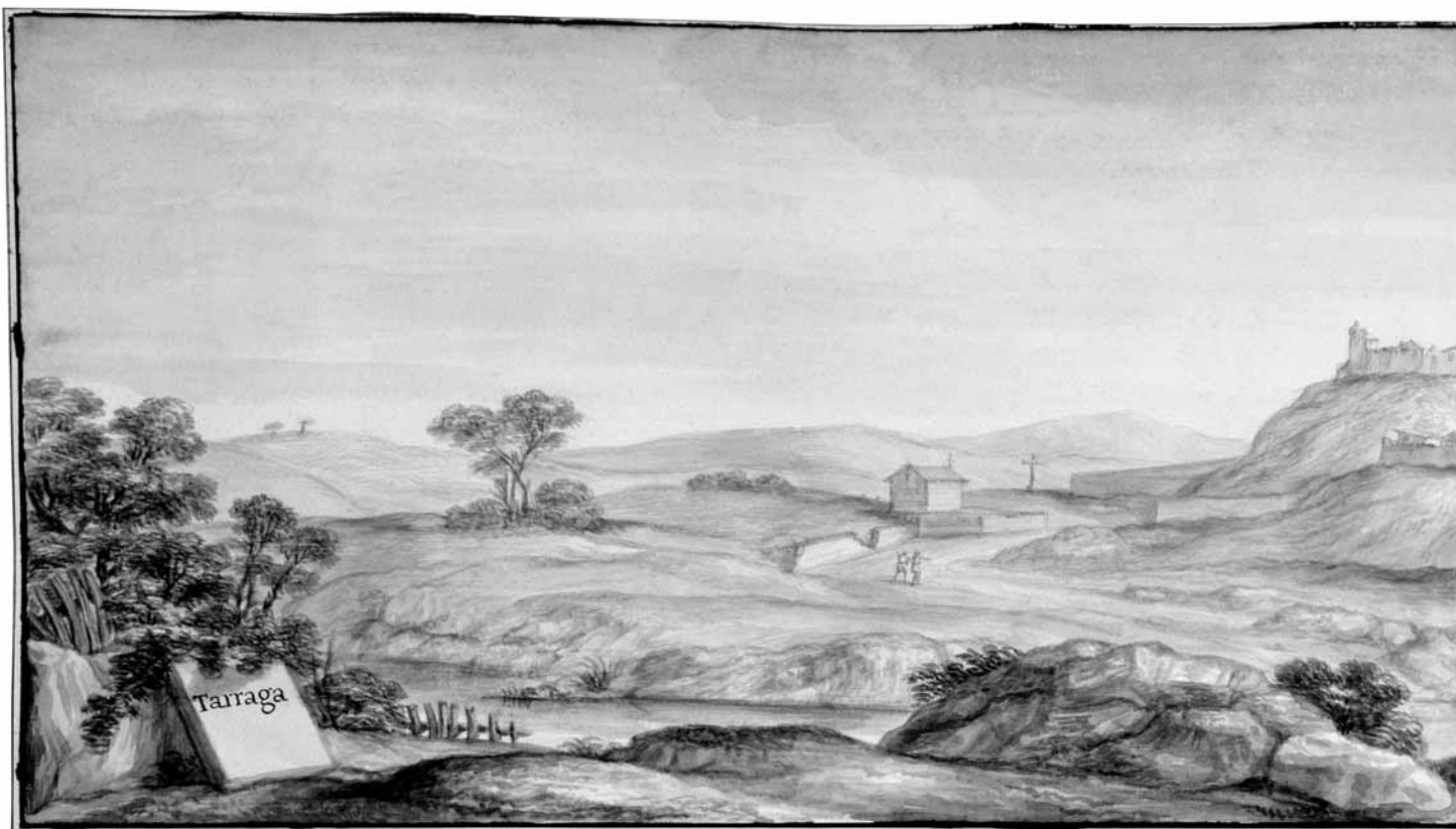
Vista de Tàrraga de l'any 1668 segons el pintor italià Pier Maria Baldi.

paper destacat i, en menor proporció, l'olivera. Altres productes complementaven l'activitat pagesa: el lli, el cànem i les hortalisses. Estaven condicionats per les inclemències del temps i també pels preus de mercat.