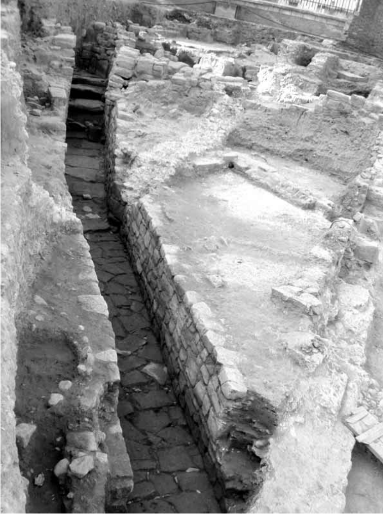
Figura 5. Colector

Drag. 15/17 que son datados hasta mediados del s. IV 18 .