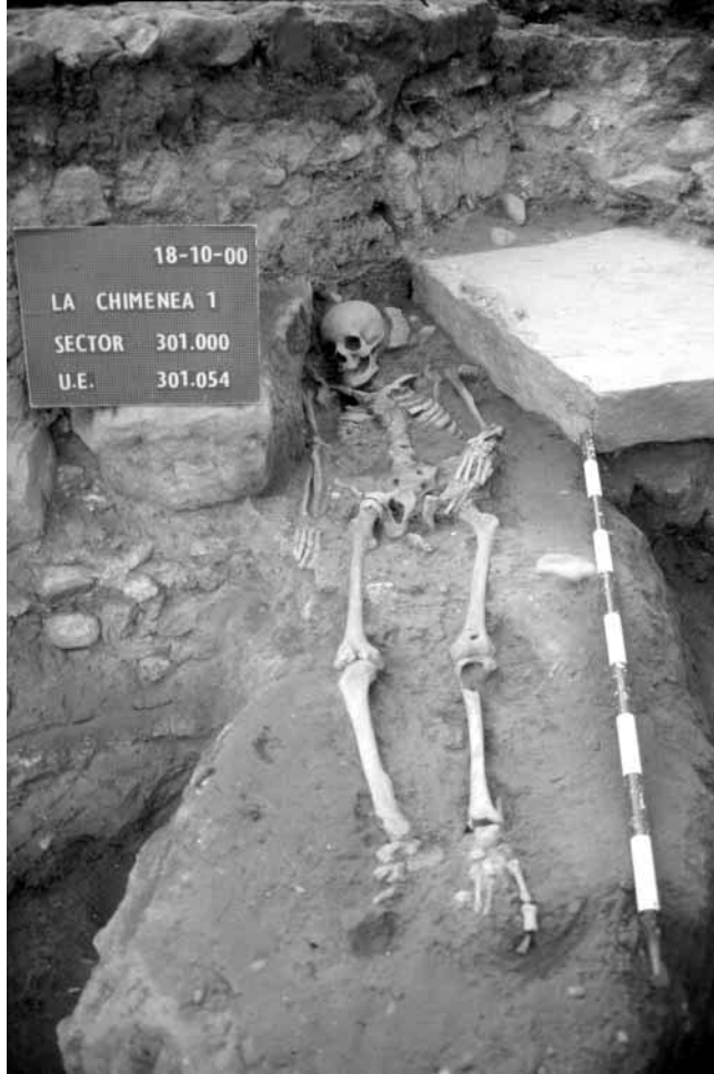
Figura 2. Inhumación amortizando un canal

factor determinante que nos permita inscribir esta necrópolis en un período concreto 12 .