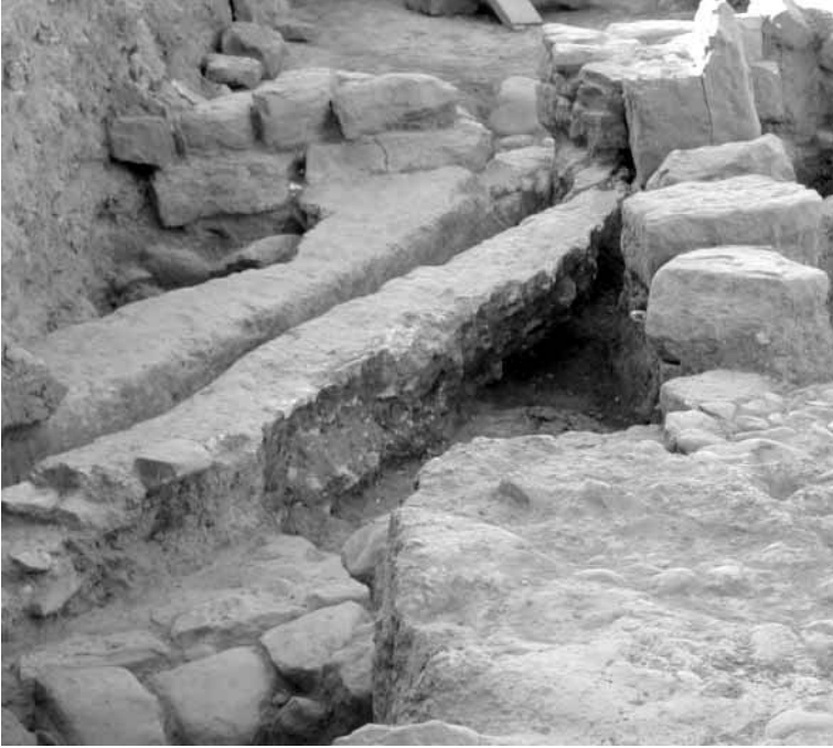
Figura 4. Canal de desagüe

prae-furnium se localizan una serie de muros y estructuras, aún no bien delimitadas, pero que a priori podrían estar relacionadas con el área de servicio de este horno.