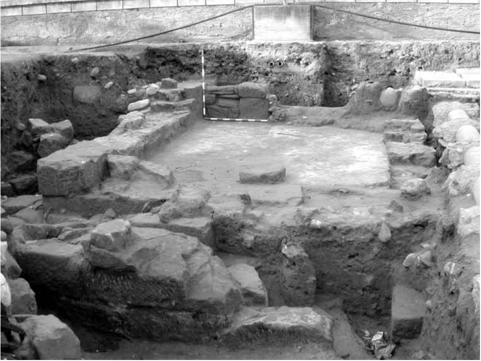
Figura 3. Hipocausto

El alto nivel de arrasamiento que presenta esta estructura, no se puede explicar únicamente por la reutilización de sus materiales para la construcción de las tumbas de la necrópolis, ya que el volumen del material constructivo recuperado es mínimo en comparación al que debería haberse encontrado, por las propias características constructivas del hipocausto. Por tanto, debemos suponer que una vez que las estructuras se inutilizan y abandonan su función originaria, la estancia debió servir como lugar de substracción de materiales fácilmente extraíbles y reutilizables para otras construcciones.