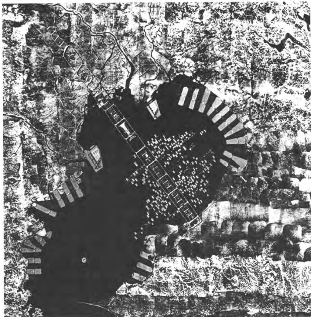
Kenzo Tange. Plan para Tokio, 1960.