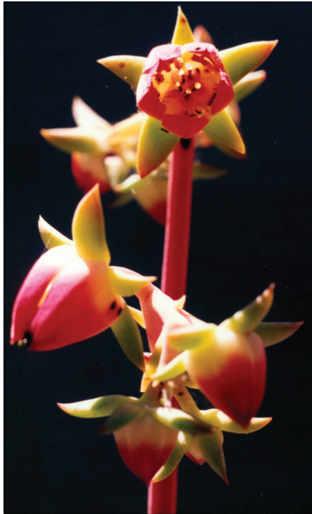
Fig. 2. Inflorescencia de Echeveria patriotica , las flores muestran los colores de la bandera mexicana que denotan el epíteto específico.

color rojo-púrpura, las otras los tienen blanquecino-amarillentos. El segundo subconjunto está integrado por plantas caulescentes, con pocas hojas, rara vez en roseta basal, las láminas por lo general son manifiestamente pseudopecioladas y sus flores tienen los nectarios pálidos; aquí pertenecen: E. acutifolia Lindley, E. crenulata Rose, E. fimbriata C. H. Thompson, E. gibbiflora De Candolle ( E. grandifolia Haworth, E. violescens E. Walther, E. gibbiflora var. violescens (E. Walther) Kimnach), E. gigantea Rose & Purpus, E. grisea E. Walther, E. longiflora E. Walther, E. pallida E. Walther, E. rubromarginata Rose y E. nayaritensis Kimnach.