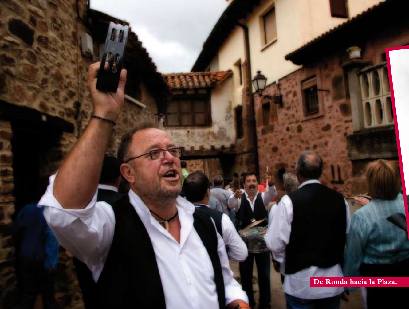
De Ronda hacia la Plaza.