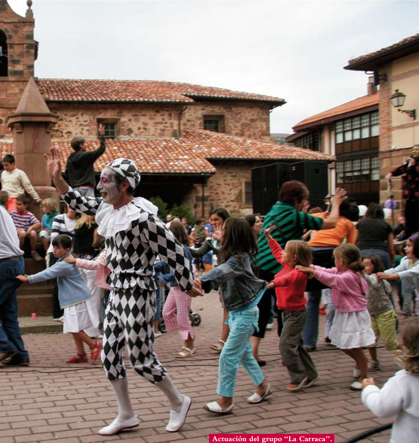
Actuación del grupo “La Carraca”.

La raíz de la música está en las cadencias del trabajo y los sonidos de la naturaleza, que se transformaron en los primeros ritmos y armonías. Los que acudimos al primer festival de música folk de Valgañón descubrimos cómo los instrumentos musicales nacen de los utensilios rescatados de las cocinas, de las herramientas de la fragua o de los aperos de labranza, y