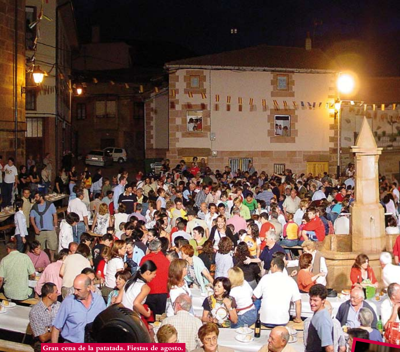
Gran cena de la patatada. Fiestas de agosto.

futuro transmitiéndolas y grabándolas para el gran público. Algunos de ellos se dedican a la recuperación de instrumentos, ritmos y coplas de regiones concretas, mientras que otros apuestan por el mestizaje de culturas y tradiciones musicales, reinventando y creando nuevos temas de carácter tradicional.