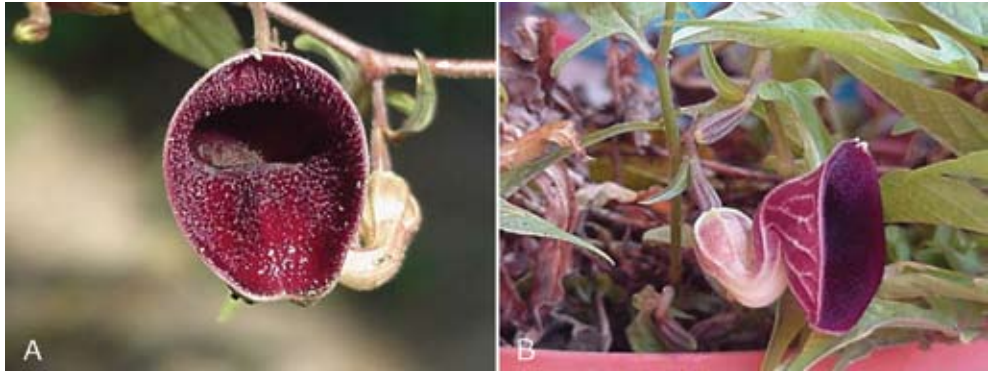
Fig. 2. Flor de Aristolochia emiliae vista de frente (A) y de costado (B).

lóbulos de 1-1.5 mm de largo, estípites de 0.5-1 mm de largo, estambres 5, anteras de 1.5-2 mm de largo, 1 mm de ancho; fruto una cápsula ovoide 5-carpelar, piloso, de 2-3 cm de largo, 1.7-2.5 cm de diámetro, dehiscencia basicaida, semillas triangulares, numerosas, negras, de 5-6 mm de largo, 4.5-5.5 mm de ancho, 1 mm de grueso, superficie finamente tuberculada.