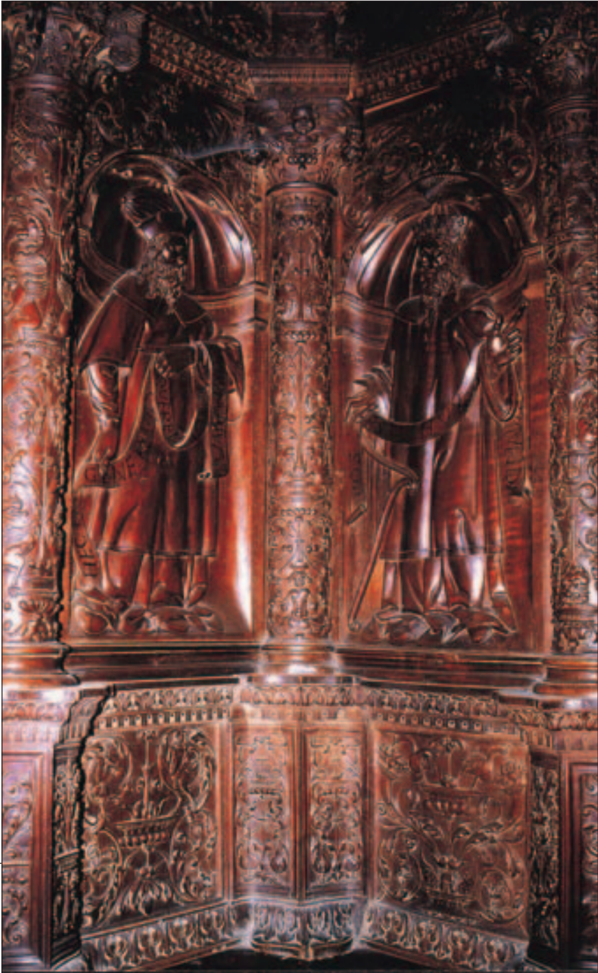
Lámina 2.-Rincón alto de la Catedral de Santo Domingo de la Calzada