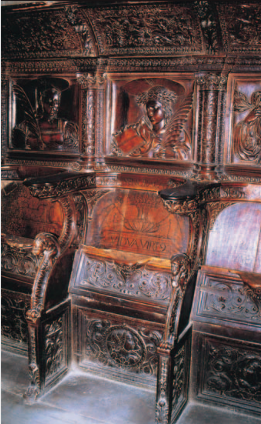
Lámina 1.-Sillas bajas de la Catedral de Santo Domingo de la Calzada