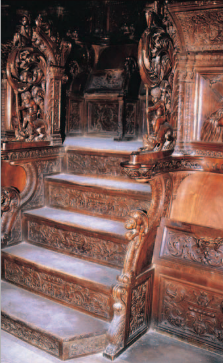
Lámina 3.-Escalera y crosas de la Catedral de Santo Domingo de la Calzada