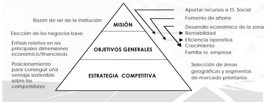
Figura 1. Interrelación entre la misión, los objetivos y la estrategia de las Cajas de Ahorros