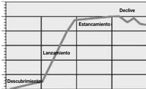
Gráfico 1 Ciclo de vida del producto turístico

Si nos ceñimos a una visión del ciclo de vida del producto, veremos que existen varias etapas o fases: el descubrimiento, el lanzamiento (donde se encuentra actualmente la talasoterapia, como se muestra en el gráfico 1), el estancamiento y el declive del producto.