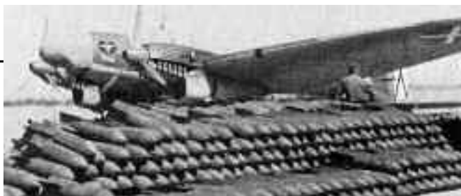
Vista lateral izquierda de un he-111 de la Legión Condor delante de un depósito de bombas.

Gewissen falsche Erinnerungen generierten» (Erl 2003: 157).