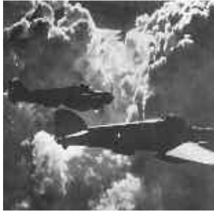
Foto en vuelo a contraluz de una pareja de sm-79.

Crearon el Dornier Do 17, que los alemanes denominaban lápiz volador debido a su aerodinamicidad, y el Messerschmitt BF 109, que «erreichte bis zu 560 Stundenkilometer, hatte kugelsichere Treibstofftanks und eine Reichweite von 640 Kilometern». 17 En Guernica, por ejemplo, se pusieron a prueba 12 tipos de aviones de combate, de los cuales algunos fueron producidos en serie. También se evaluó el efecto de las bombas en terreno y población (cf. Kogelfranz/Platte 1989: 328). Asensio realiza el siguiente balance: «Desde julio de 1936 destruyeron 386 aviones enemigos (313 en combate aéreo) con la pérdida de 232 (de los cuales sólo 76 lo fueron por acción enemiga), lanzando unas 21.000 toneladas de bombas, y perdiendo la vida 226 hombres» (Asensio 1999: 4).