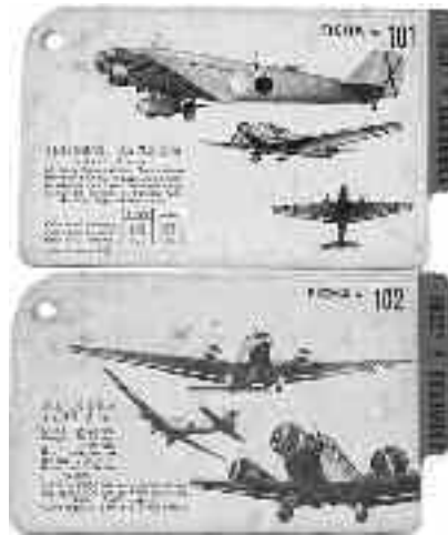
Fichas originadas empleadas por los observadores republicanos para reconocer al Ju-52.

Riesgo (2003: 278) escribe que a los alemanes, especialmente a von Faupel, emba-