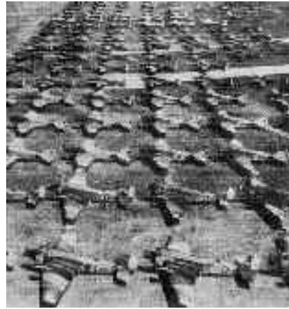
JU52 parada militar al final de la G.C.E. en primer plano aparecen al menos 13 Ju-52, detrás SM-81.

Con respecto a Guernica, los pilotos de la Legión Cóndor quedaron muy satisfechos de su éxito - hasta que se les prohibió hablar de ello. Nunca llegaron a comprender la decepción causada por esta misión. Para v. Knauer el ataque no supuso ningún acontecimiento especial en su vida personal: «Ich habe diese dortigen Angriffe und diese Einsätze als Soldat, der seinen Befehl erhält und unter Einsatz meines Lebens geführt und auch im Bewusstsein, wie wir es damals meinten, im Krieg, und zwar im gemeinsamen Kampf, gegen den Kommunismus» (Brieden/Dettinger/Hirschfeld 1997: 77). Más adelante culparon a los republicanos o intentaron a toda costa evitar el tema. El piloto Hoyos no dedica a Guernica ni una sola palabra en sus memorias. Adolf Galland, modelo hasta hoy para muchos oficiales, se enfrenta al pasado de la siguiente manera: «Als sich der Qualm der Einschlüge, in die ein paar Staffeln ihre Bomben geworfen hatten, verzog, stellte man fest, dass die Brücke unversehrt geblieben war, die angrenzende Ortschaft jedoch allerlei abbekommen hatte» (Kogelfranz/Platte 1989: 326). 29 Por lo general, los soldados de la Legión Cóndor no han mostrado arrepentimiento. Tenemos constancia de ello por sus memorias. 30