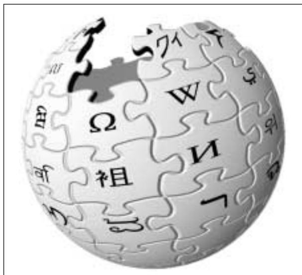
Símbolo de Wikipedia.

"Esta obra monumental respira la misma orientación que la propia internet: distribuir, compartir y cooperar libremente"