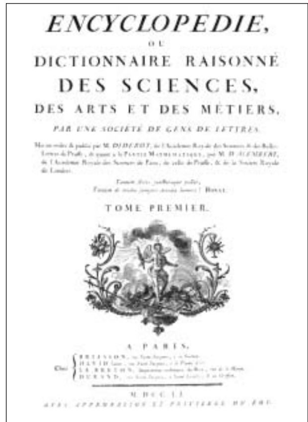
Portada de la edición original de la Encyclopédie (1751).

En segundo lugar, emplea software comunitario, abierto para los diseños y el mantenimiento del sistema. El mecanismo que posibilita que la nueva información sea accesible de forma inmediata (además de