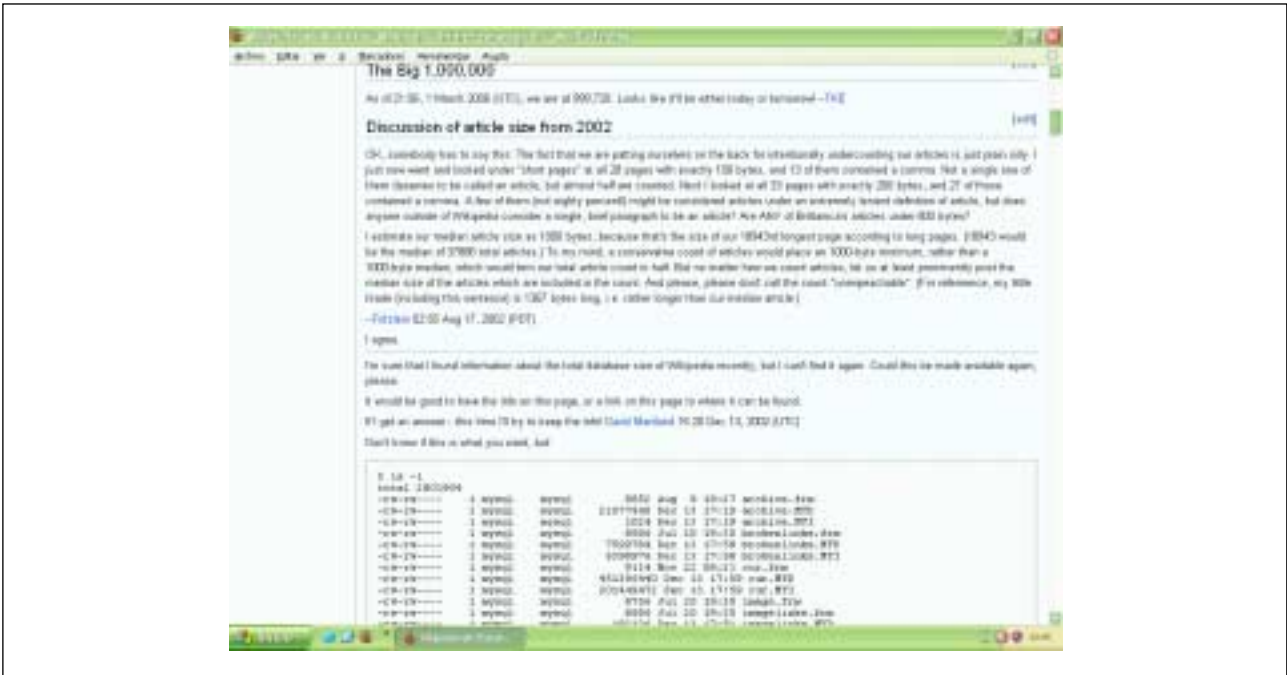
Una página de discusión de un artículo de la edición en inglés de Wikipedia.

el número de artículos consultados por cápita supera al de Estados Unidos, se han generado más de 360.000. En 2004 su tasa de crecimiento era de 1.000 a 3.000 entradas diarias como promedio entre las ediciones en diferentes lenguas (véase la tabla "Cifras de Wikipedia").