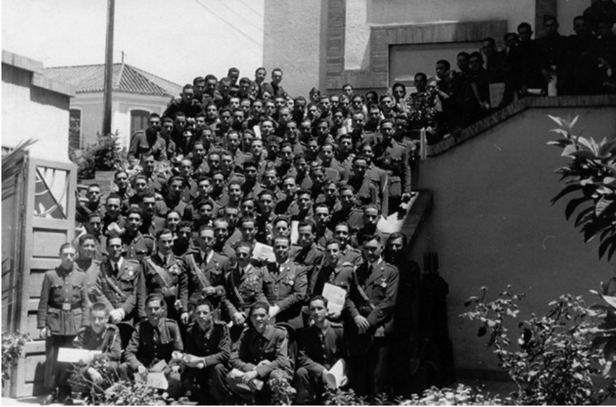
6.- Alumnos del 6º Curso

gui y cabo Alfonso de Mazas. Las reses fueron de la vacada de Arias Reina y el festival fue organizado por el teniente Espinosa Aparicio y presidido por la viuda de García Morato.