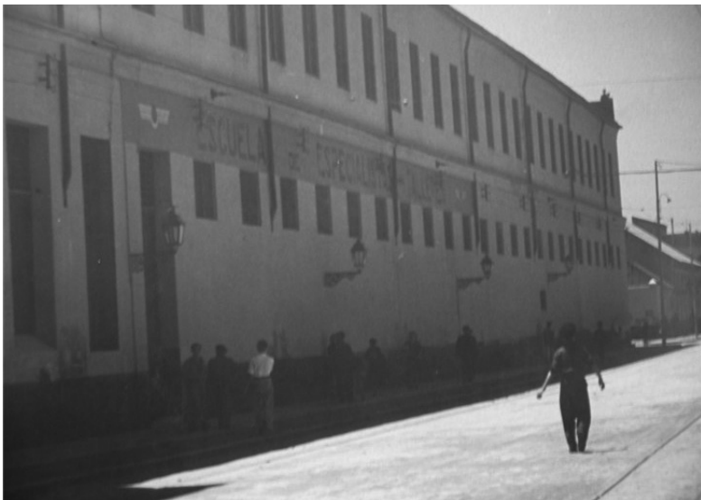
2.- Talleres calle Ayala

la zona, situada a la derecha de la desembocadura del Guadalmedina y a las afueras de la ciudad para la instalación de percheles y casas donde determinaron se hiciesen las anchoas, sitio que se determinó para quitar de la ciudad el hedor que causan estos pescados. A cada perchel se le dio un largo de 18 varas y se dio licencia a los vecinos para edificar 39 casas para hacer anchoas 5 .