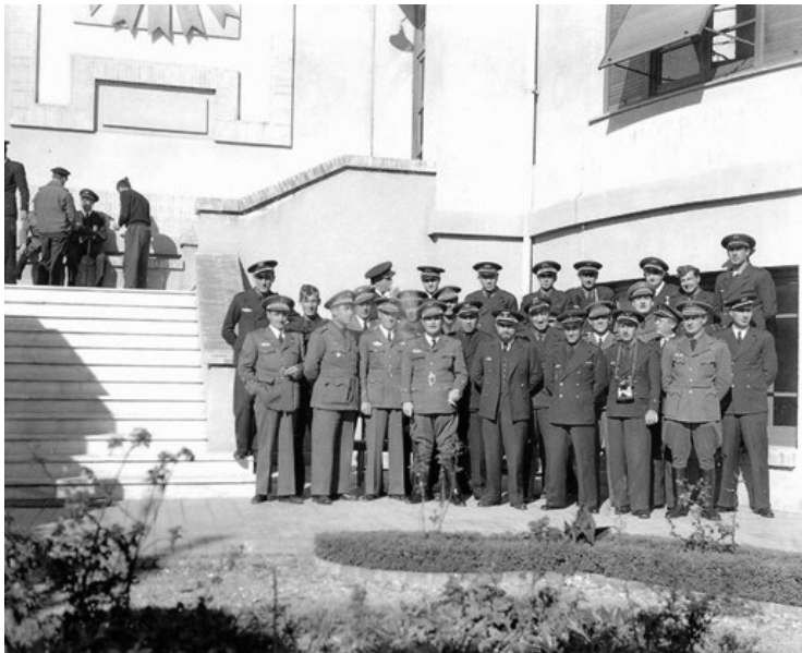
3.- Profesores del 2º Curso