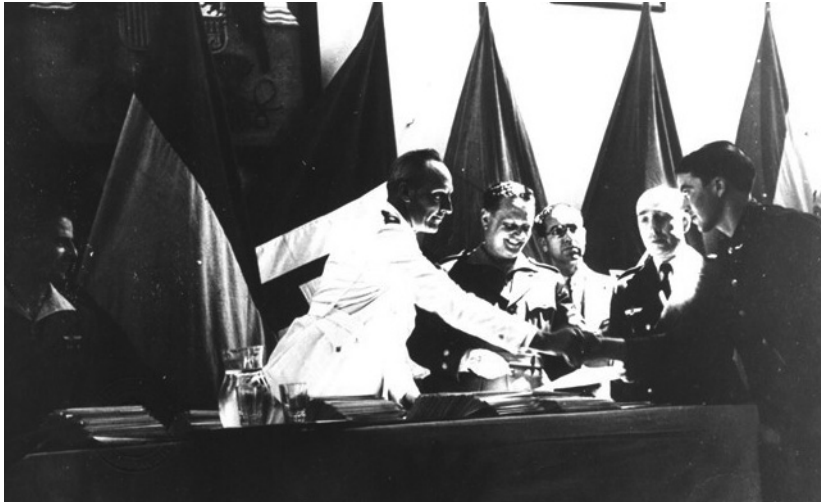
5.- Entrega de Diplomas al 3º Curso

Para el 4º Curso , que daría comienzo el 5 de octubre de 1939, se convocaron 530 plazas (150 motoristas, 50 montadores, 150 radios, 80 electricistas y 100 armeros). Como la guerra ya había terminado no era tan urgente la necesidad de especialistas y el curso se prolongó hasta nueve meses. Terminó a finales de junio, jurando bandera el día 3 del mes siguiente con asistencia del Infante de Orleans y las principales autoridades malagueñas.