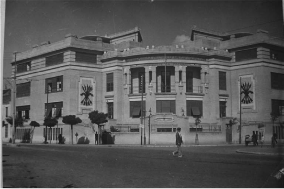
1.- Escuela de Especialistas, calle Cuarteles

En 1933 fue comisionado por la Sociedad de Naciones durante más de un año, para mediar en el conflicto entre Perú y Colombia por el territorio amazónico de Leticia, misión que aprovechó para explorar la cuenca del Amazonas en hidroavión, reuniendo una gran colección de plumario, objetos etnográficos e incluso animales para el zoológico de Madrid. Proyectó continuar este estudio con una expedición fluvial en el barco hidrográfico “Ártabro”. Se construyó el barco, se creó un Patronato y se acordó iniciar la expedición el 12 de octubre de 1935, fiesta de la Raza, pero “por dificultades surgidas entre el Patronato de la Expedición y la Presidencia del Consejo, al respecto del pago de los sueldos, haberes y gratificaciones que el personal expedicionario debía recibir” la expedición fue retrasada y definitivamente suspendida.