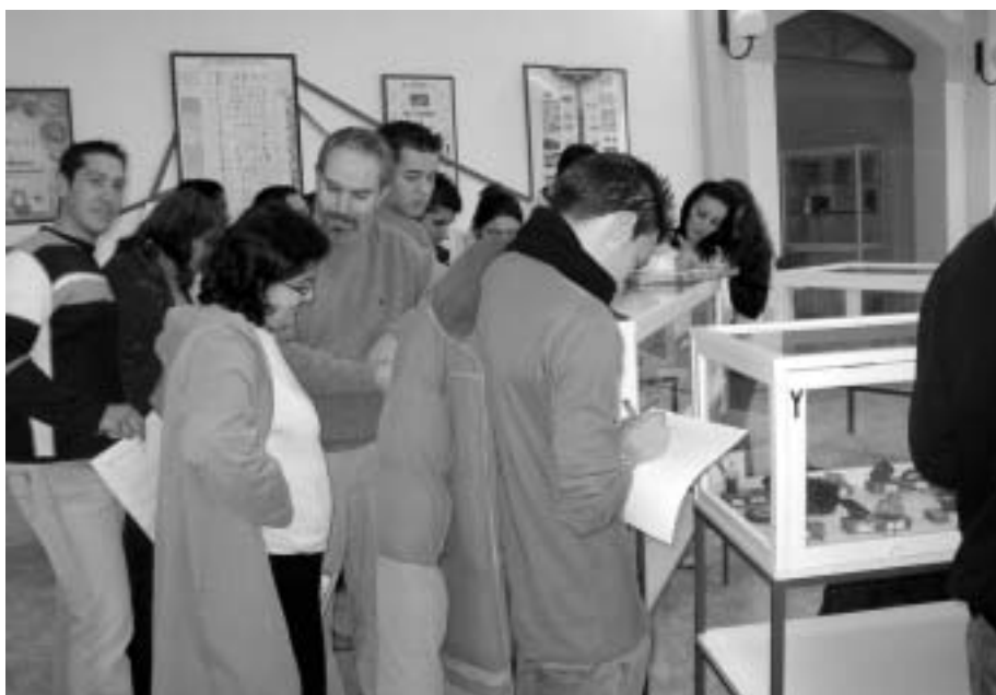
Alumnos y alumnas de Educación Secundaria de Adultos del I.E.S. "Alto Guadiato"

Con fecha 7 de Abril del 2006 se nos comunicó la resolución de la Dirección General de Museos por la que