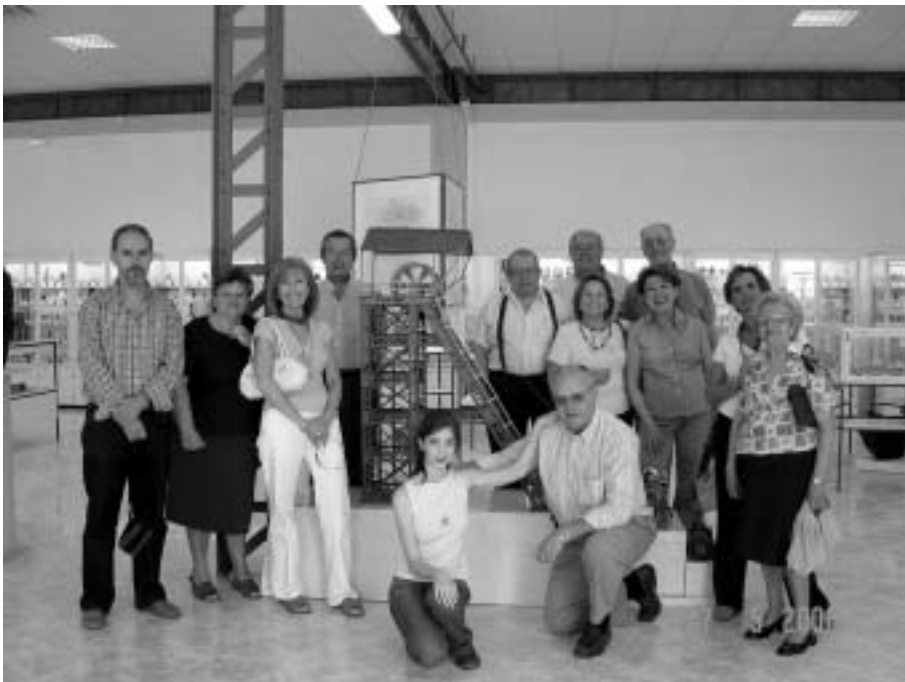
Grupo de Sevilla junto al castillete minero

Por otro lado, se ha publicado un artículo en la revista de feria de Agosto y ha continuado la publicidad en diferentes medios de comunicación.