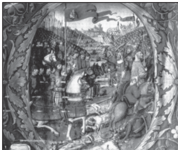
Imagen 6.- Grabado de la batalla del Salado tomado de un manuscrito del monasterio de Guadalupe.

avanzó hasta alcanzar el tramo final del curso del Salado aprovechando que allí existía un puente. El buscar puentes, vados y vaguadas, no es puro capricho ya que si los primeros facilitan el paso de las corrientes evitando el blando suelo del fondo de un río, las vaguadas eran los accidentes geográficos más favorables para llegar hasta el corazón de las filas musulmanas ya que hacer subir los caballos por pen-