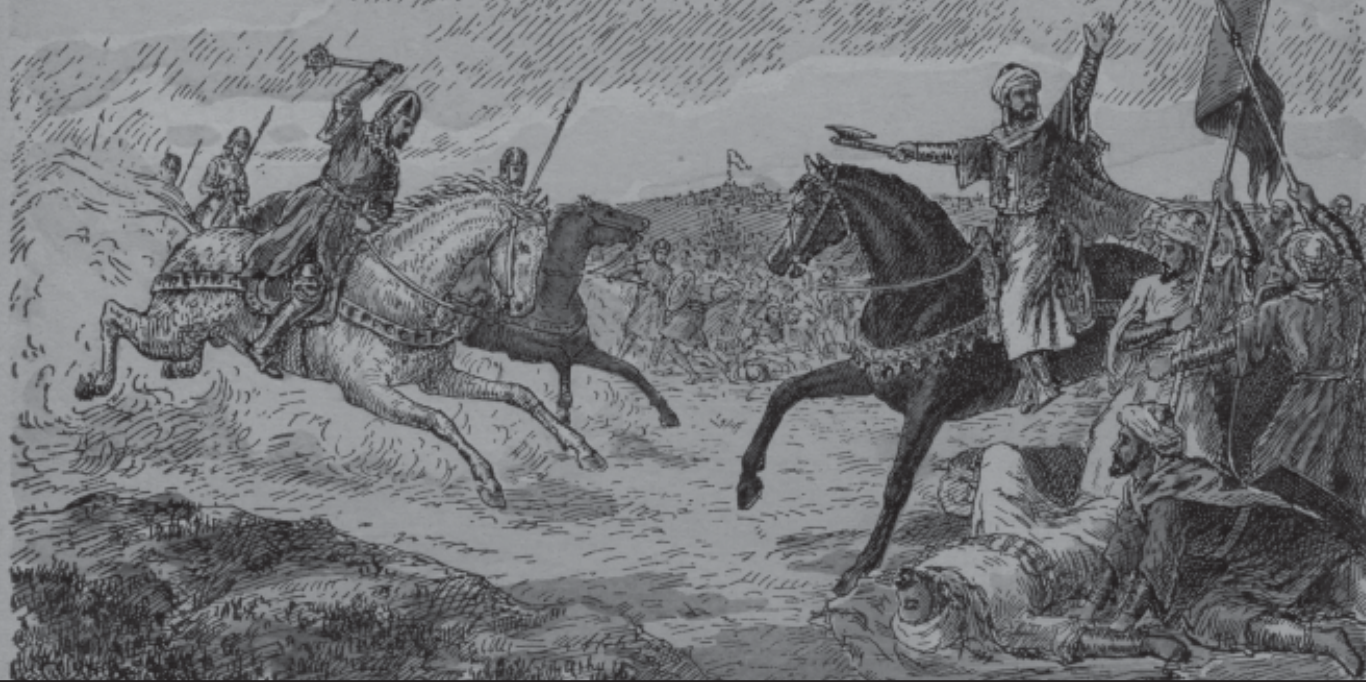
Imagen 1.- Dibujo representando una escena de la batalla del Salado, ocurrida en Tarifa en el año 1340.