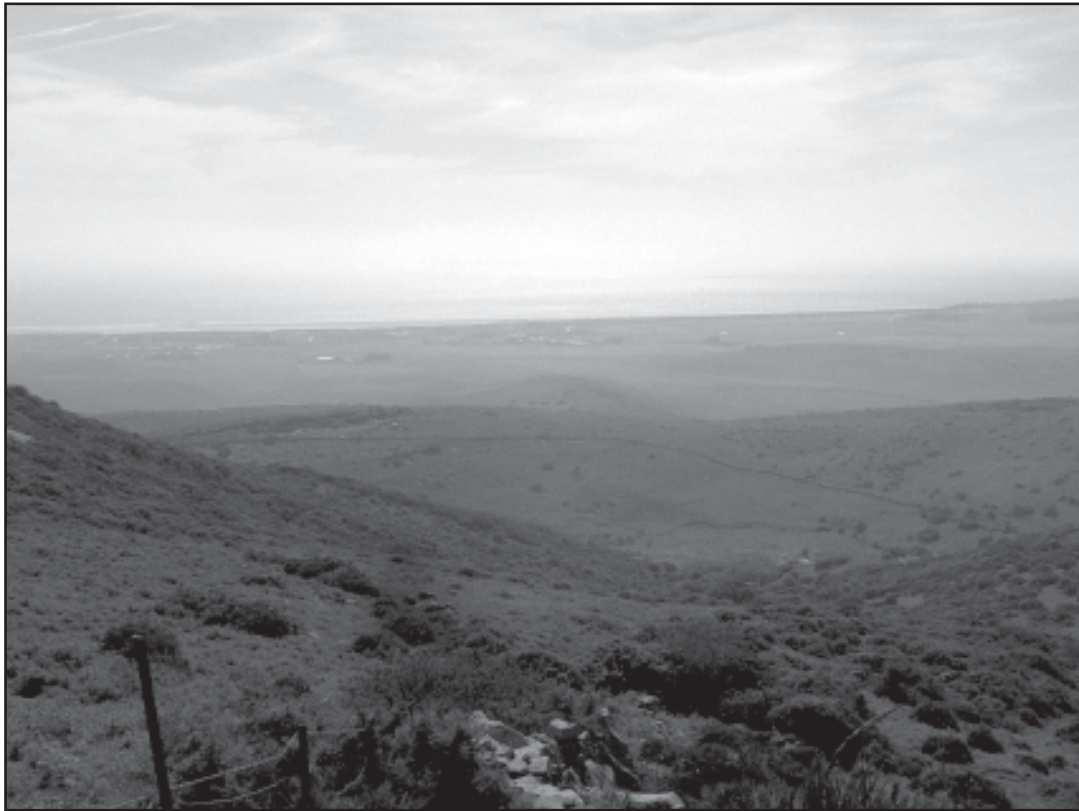
Imagen 5.- Perspectiva del campo de batalla desde la posición ocupada por los benimerines. Al fondo se divisa la playa de los Lances.

Por otro lado, y a propuesta de don Juan Manuel, Alfonso XI decidió enviar aquella noche a Tarifa 1.000 hombres de a caballo y 4.000 de a pie con el objeto de reforzar a la guarnición de la plaza y, junto a los de la flota, atacar los primeros y por la retaguardia a los benimerines para que éstos ocuparan a parte de sus fuerzas en frenar el ataque procedente de Tarifa.