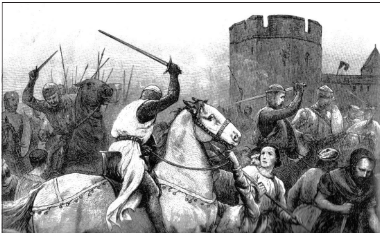
Imagen 3.- Dibujo idealizado de la batalla del Salado.

ensanchando paulatina y constantemente a medida que el curso del Salado se aproxima a su confluencia con el río Jara. Las lomas que flanquean este valle por occidente –las de Los Prado, Las Juntas y Media Baja, que a su vez separan las cuencas del arroyo de Ramos y del Salado– tienen respectivamente 98, 87 y 48 metros. de altura, de manera que van descendiendo suavemente y a unos 1.500 metros de la playa no superan ya los 10 metros. de cota. Por lo que se puede decir que a partir del final de estas lomas el curso del Salado atraviesa una extensa llanada que viene a ser la prolongación de la que se forma en la margen izquierda del río Jara.