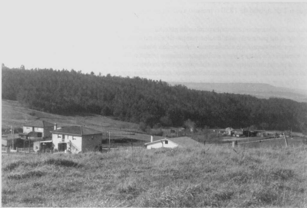
O lugar de Mangoño na parroquia de Santo Tomé de Salto (Oza dos Ríos). Véxase o fermoso val agrícola, salpicado de casas, cos antigos montes veciñais ó fondo, mentres no horizonte (a occidente) se divisa o lonxano e granítico Monte de Xalo

¿En que consistiu, pois, este choque entre lugares colindantes? Así o conta A. López: