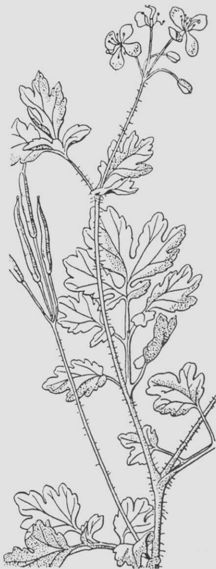
Fig. 7.- Celidonia ( Chelidonium majus ), de tamaño natural (Dioscórides, p. 246).

Hay quienes quieren ver allí hojas de carballo ( Quercus robur L.) y otros, de vid. Aun-