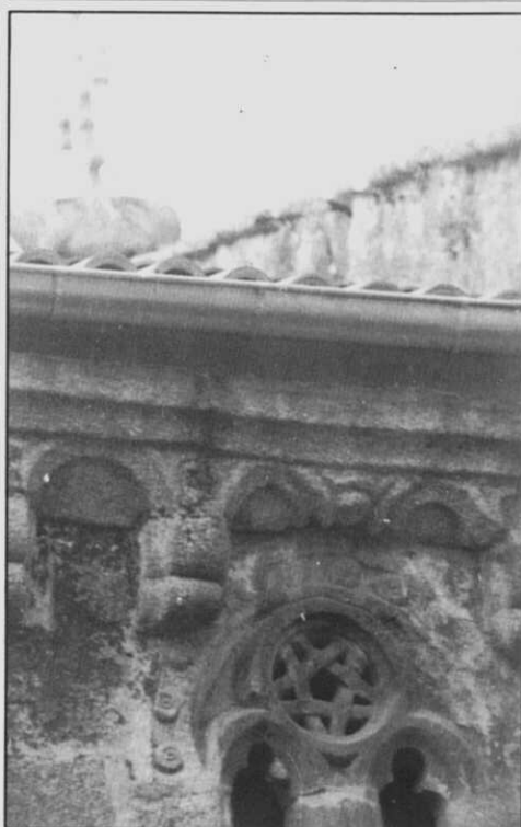
Fig. 3.- Ventana con pentalfa del muro Sur de Santa María del Azogue.