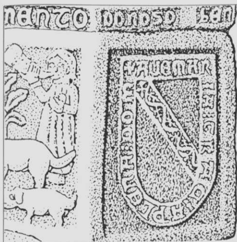
Fig. 6.- Escudo de Fernán Pérez de Andrade en los pies de su sepulcro.

gelio, o en la puerta principal de Santa María del Azogue, etc. En la puerta N de esta misma iglesia (Fig. 5), la escena que vemos, es, otra vez, la del pesaje de almas a cargo de San Miguel. Como es notorio, esta misma función en Egipto correspondía al dios Thot, en la Grecia antigua a Hermes, que para los romanos era Mercurio y que, cristianizado, se convirtió en San Miguel (7).