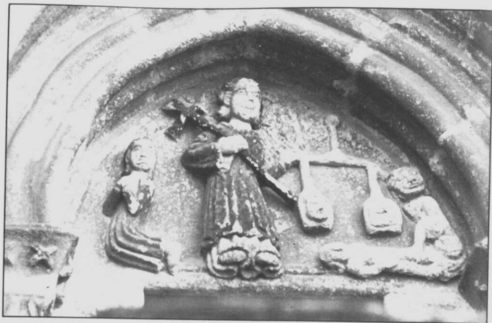
Fig. 5.- Psicostasia. Tímpano de la puerta Norte de Santa María del Azogue.

El sello de Salomón (o también estrella de David), no es, como se piensa vulgarmente, un símbolo exclusivamente judío (5). Su uso era corriente en todo el Mediterráneo, y mucho más allá, desde tiempos remotos. Sabido es que en la época que nos interesa, la astrología, la Cábala, la cartomancia, la alquimia y, en general, las doctrinas esotéricas eran lo que son hoy las ciencias modernas: base del conocimiento humano. (Baste recordar, entre muchos otros nombres, los de Alfonso X El Sabio, Ramon Llull, Moisés de León...).