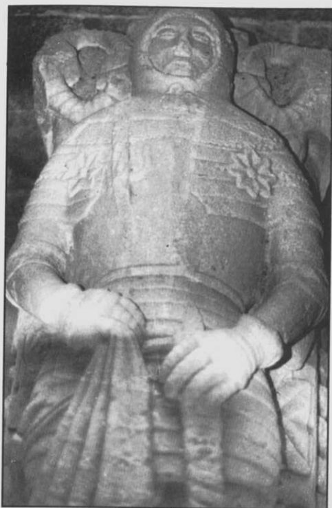
Fig. 8.- Lauda sepulcral de Nuño Freire de Andrade en Monfero.