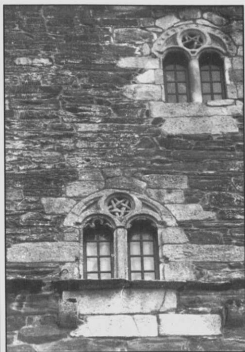
Fig. 4.- Ventanas con pentalfa del muro Norte de la torre del homenaje del palacio de Andrade en Pontedeume.

En el mismo muro S de Santa María del Azogue, al lado de la hexalfa, encontramos