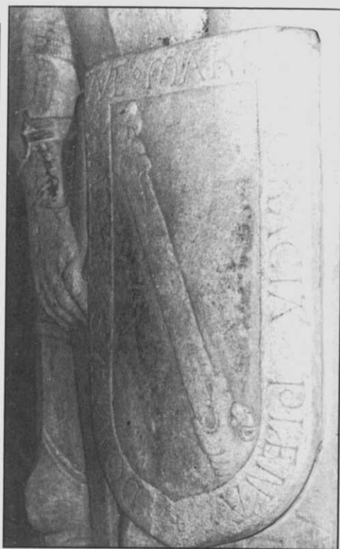
Fig. 11.- Escudo del sepulcro de Diego de Andrade en Monfero.

Arquitectura gótica en Galicia. Los templos: