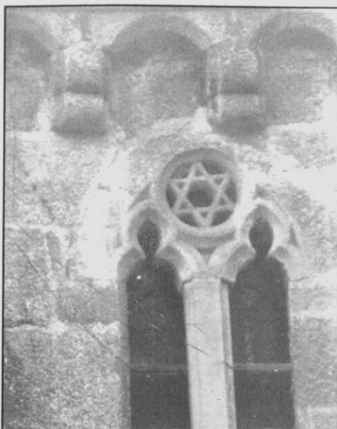
Fig. 2.- Ventana con hexalfa del muro Sur de Santa María del Azogue.