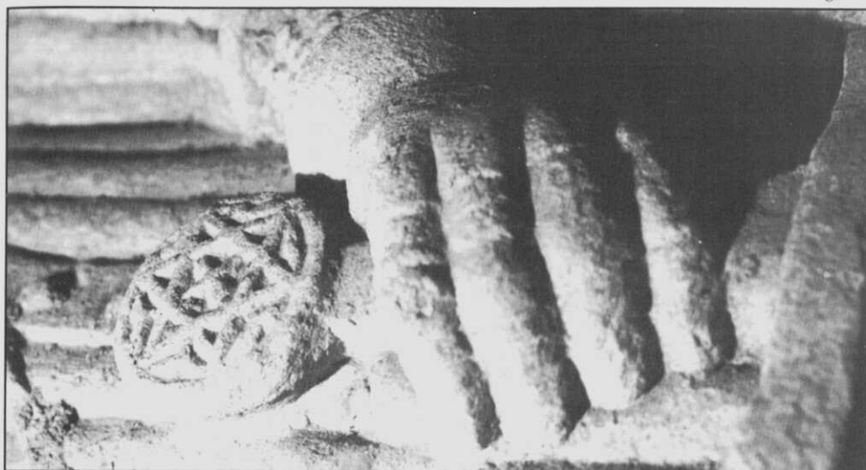
Fig. 1.- Pomo de la espada de Fernán Pérez de Andrade (S. Francisco de Betanzos).