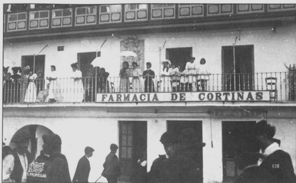
Farmacia de Cortiñas en 1907.

en que aparece en las listas de las personas que deben formar parte de la Junta Municipal de Sanidad, aunque no es elegido (4).