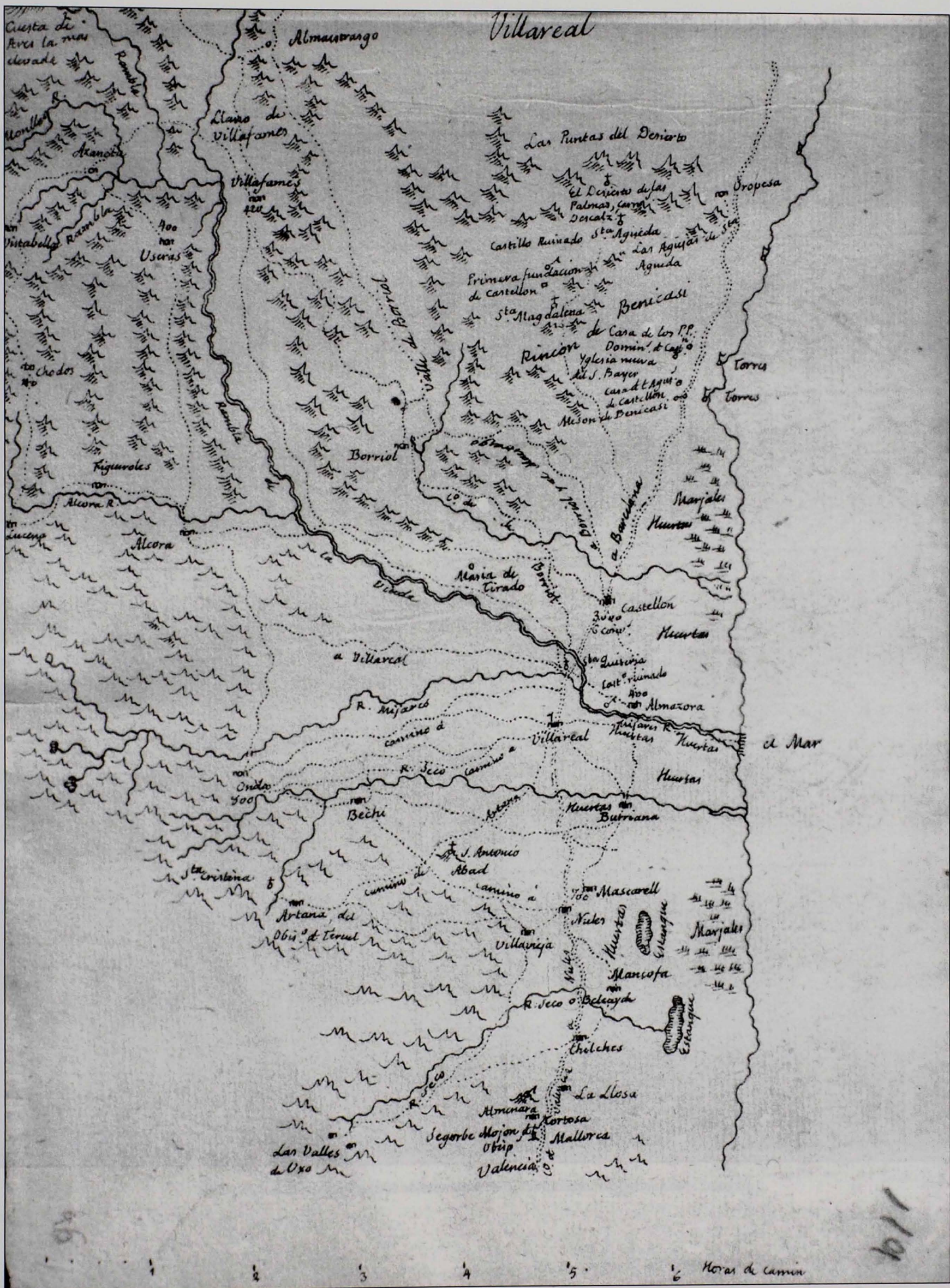
Imagen 2: Mapa-borrador de Tomás López. Véase nota 156.