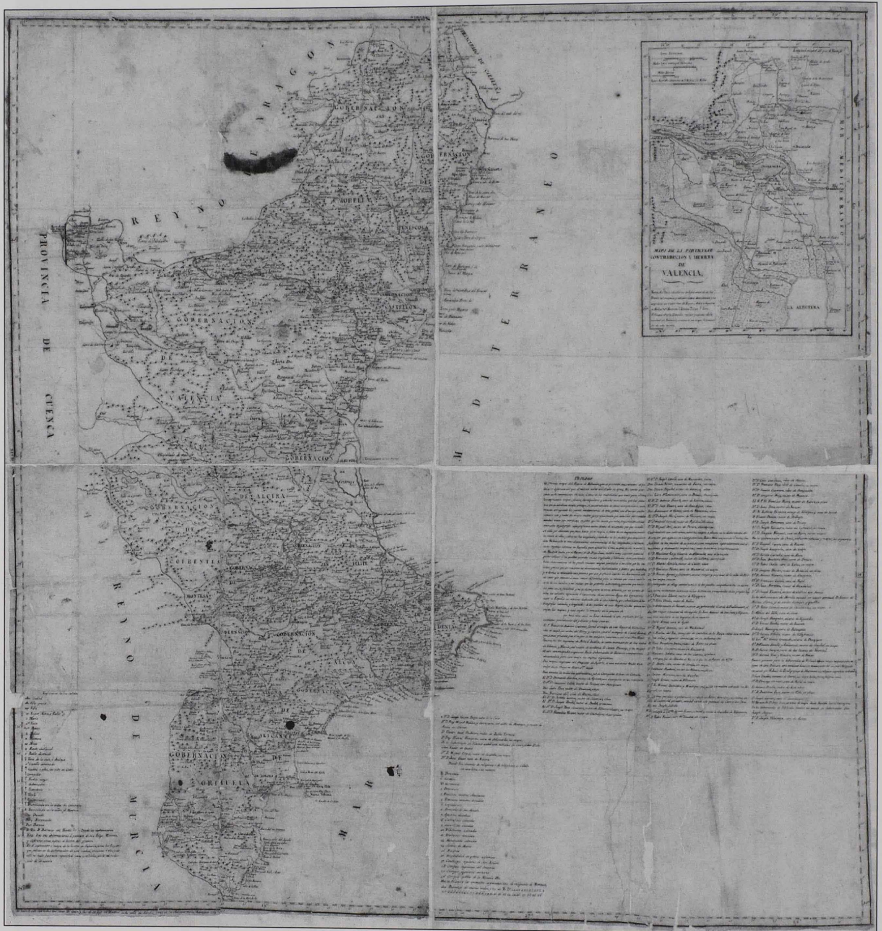
Imagen 3: Maqueta del mapa del reino de Valencia de 1788. Véanse notas 177 y 190.