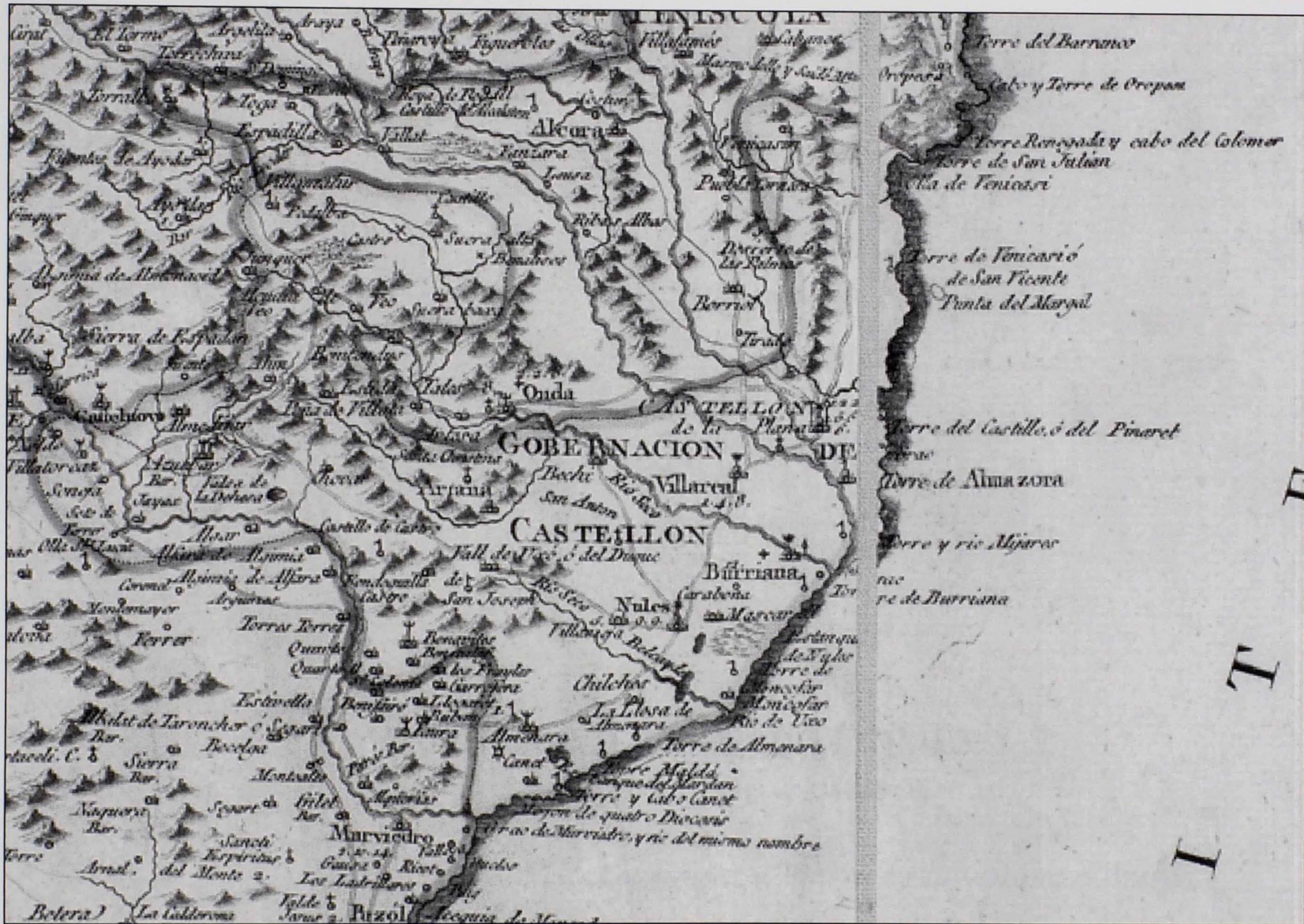
Imagen 6: Fragmento del mapa del reino de Valencia de 1788. Véase nota 189.