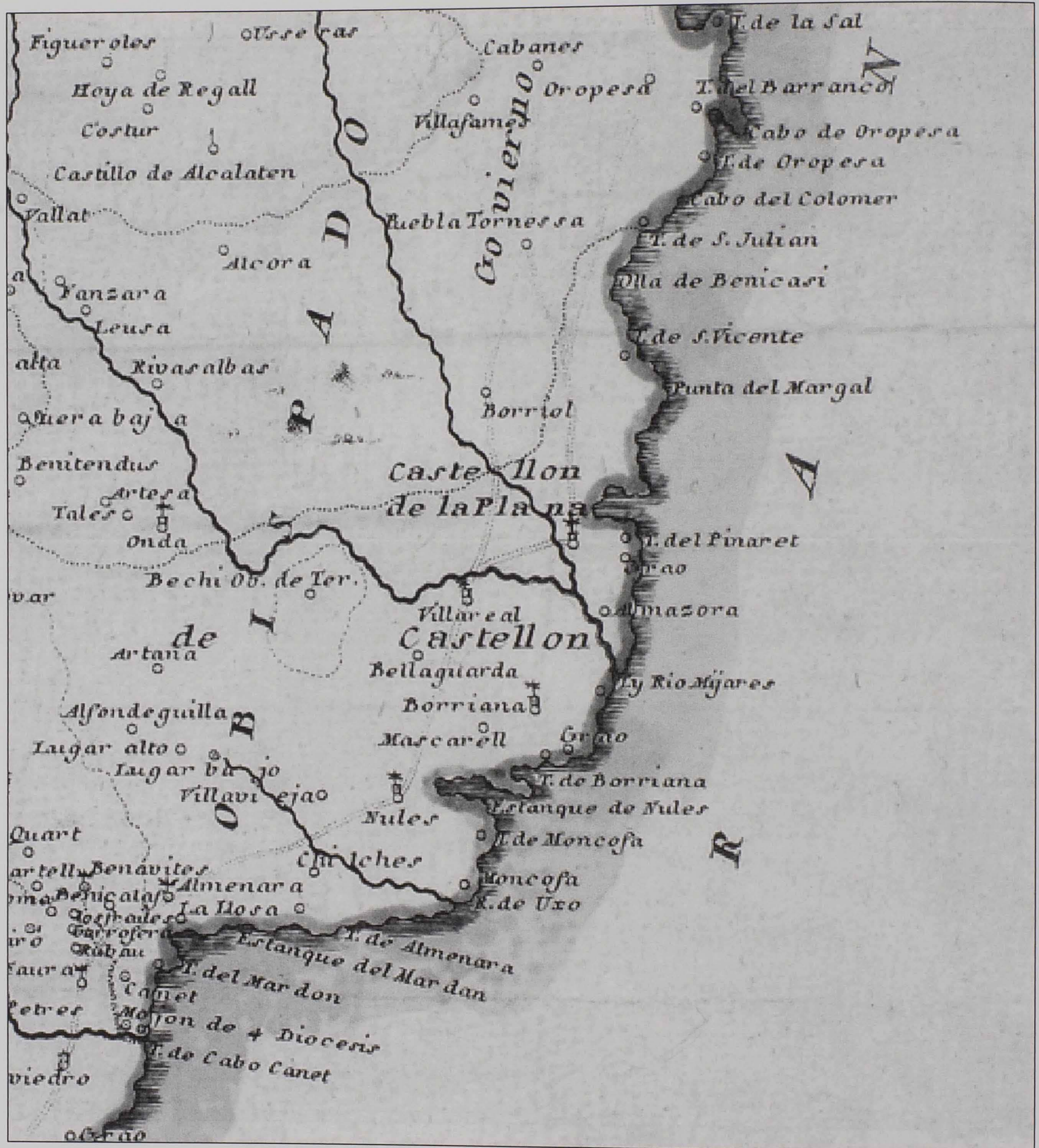
Imagen 5: Fragmento del mapa del reino de Valencia de 1762. Véase nota 188.