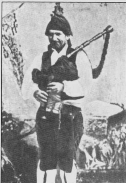
O gaiteiro de Guillarei no 1904.

"Chumín de Céltigos" (1823-1911), do que fala Enrique Chao Espina nunha das súas obras (22), foi un gaiteiro moi popular polas bisbarras de Viveiro e Ortigueira. Chumín debía ser un gaiteiro tradicional, alleo a innovacións, a xulgar polo sarcástico comentario co que enxuzaba a Ventosela, quen empregaba chaves no punteiro para da-los semitonos: " Ventosela, Ventosela. Moita chavería na canaveira ".